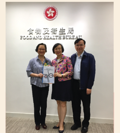
13/11 促進醫療保障融合

關注組與食物及衛生局局長陳肇始教授及其團隊會面，促進兩地政府在四項醫療「先導計劃」的合作方向及相關安排上達成共識。