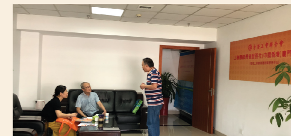
福建中心協助杜先生申辦廈門醫療保險計劃。