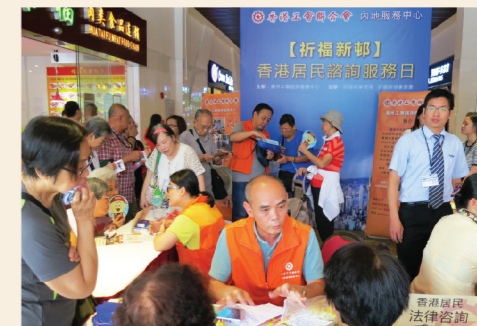
內地中心不定期在各口岸、車站，以及港人聚居的地方提供「免費法律諮詢服務」及生活資訊。

內地中心一直堅持以「合情、合理、合法」的原則，為內地港人服務。14年來，累積接獲港人來電、來訪11萬6千多人次，跟進處理個案6萬1千多宗，主要涉及房產問題、長者福利、緊急援助、赴港申請、經商糾紛、遺失證件、交通事故及護送回港等事宜。2018年1月至11月期間，來電、來訪8千多人次，跟進處理個案5千多宗。