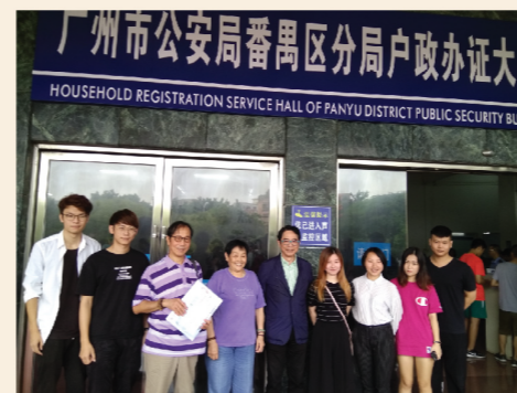
1/9 協助內地港人申辦居住證

《港澳台居民居住證申領發放辦法》2018年9月1日正式實施，我們為支持國務院對港澳台居民實施的便民政策，陪同約10名居住在穗的港人前往廣州市公安局番禺區分局戶政辦證大廳領居住證。