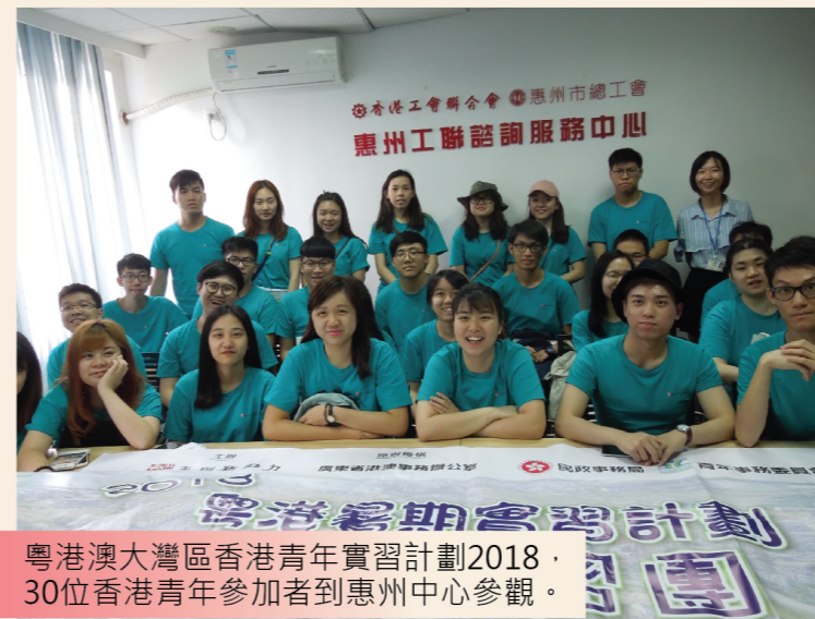
粵港澳大灣區香港青年實習計劃2018，30位香港青年參加者到惠州中心參觀。