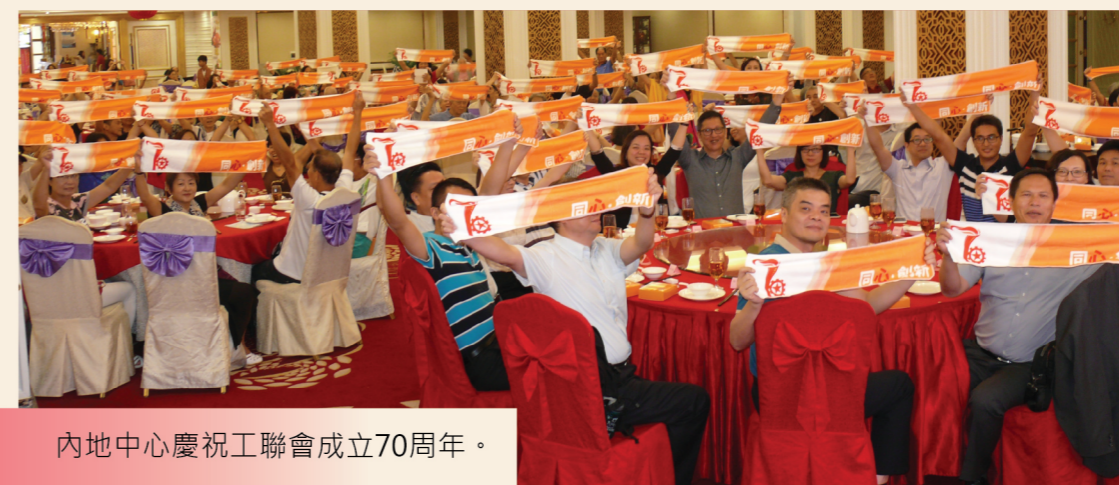
內地中心慶祝工聯會成立70周年。