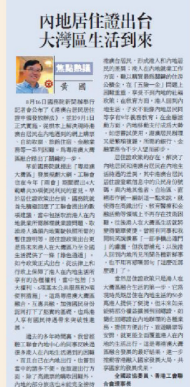
《大公報》2018年7月13日 《大公報》2018年8月20日

這些問題最終在工聯會與多部門的溝通下順利達至解決。另外一個問題就是政策到位但未能更好地「落地」，如在深圳市港人長者可以內地長者同等的優惠乘搭地鐵，卻未能購買巴士優惠證，令港人長者乘搭巴士時未能享受乘車優惠，而更甚的是還遲遲未有政策出台，如廣州市作為港人常年聚居的城市，所有交通工具未能享受長者乘搭優惠，這些都是存在不足的。見微知著，減少對市民生活上的不便，這才是大灣區生活的大前提。