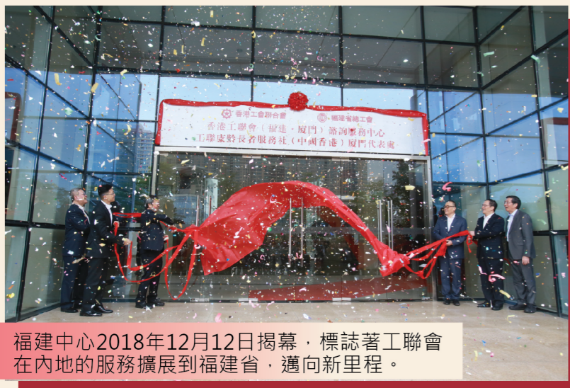
福建中心2018年12月12日揭幕，標誌著工聯會在內地的服務擴展到福建省，邁向新里程。