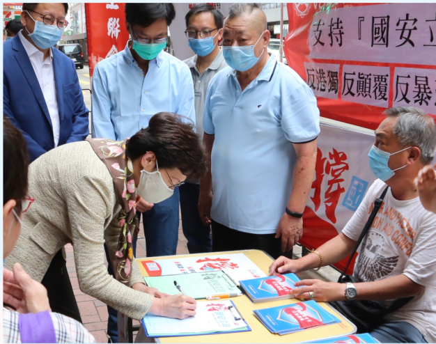
特首林鄭月娥親身到工聯會位於北角的街站簽名，齊撐「港區國安立法」。

工聯會傾盡全力推動國安立法，在審議通過之前，接連多日在全港開設街站，收集市民簽名支持港區國安立法。活動聲勢浩大，市民熱烈響應，不少人更向我們表示，「黑暴」破壞社會安寧，嚴重影響經濟民生，令市民生活苦不堪言，國安立法是香港重回正軌的保障，當全力支持！