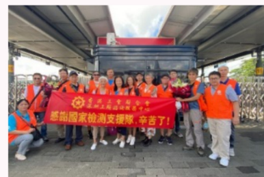
工聯會深圳中心義工隊9月16日到深圳灣口岸迎接內地核酸檢測支援隊，向隊伍全體成員無私奉獻、勇敢逆行的精神表示崇高敬意和衷心感謝。