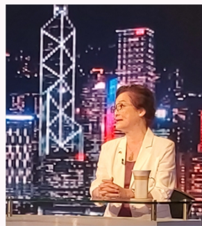
林淑儀出席時事節目支持國安立法。