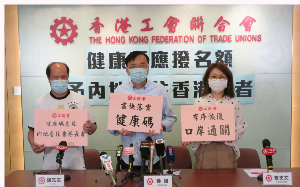
工聯會多次呼籲內地及特區政府盡快開通「健康碼」系統，尤其是要照顧到在內地居住的長期病患港人長者的需要。(中：黃國)