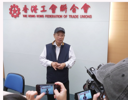
鄭耀棠向傳媒講解《港區國安法》對香港的重大意義。