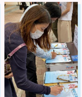
工聯會連日在全港各區開設街站，市民踴躍簽名支持港區國安立法。