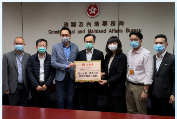
工聯會2月28日約見政制及內地事務局局長聶德權，關注特區政府專機接載滯留港人返港的安排。