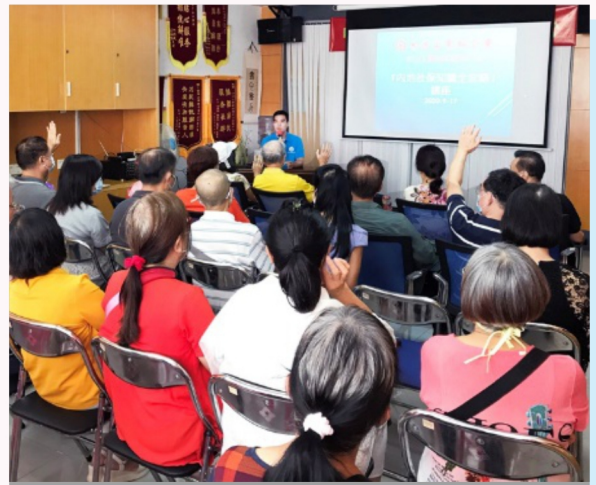
工聯會內地諮詢服務中心舉辦多場「內地社保知識全攻略」講座，讓內地港人更清楚認識國家社保的內容及可享有的權益。