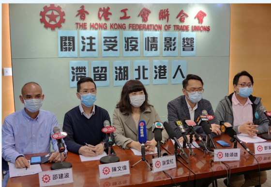
工聯會2月23日舉行記者會，要求特區政府盡快與內地部門協商，加快安排滯留港人回港，並呼籲有需要的市民，向工聯會內地諮詢服務中心尋求協助。

突如其來的新冠疫情，令大批香港市民在農曆新年後滯留內地。工聯會自2020年2月上旬不斷收到滯留湖北的港人求助，包括：有滯留港人因未能回港上班，手停口停下面臨經濟困難；有長期病患者因隨身藥物不足，急須回港覆診取藥；也有多名即將分娩的孕婦希望可回港產子。工聯會即時向中央政府、鄂省政府及特區政府反映，並要求盡快安排滯留湖北的港人回港。