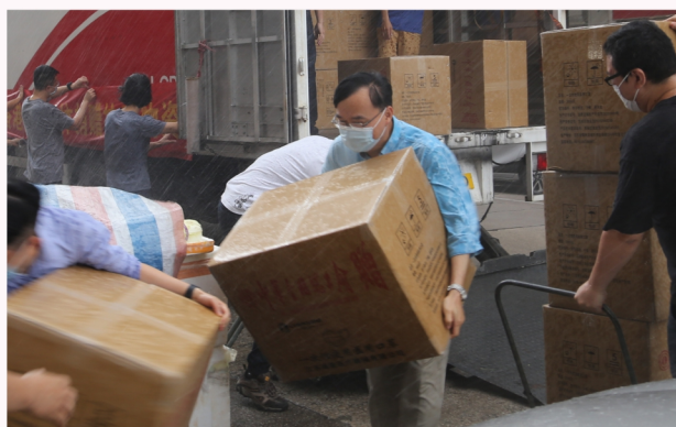
中華全國總工會8月18日捐贈30萬個口罩，工聯會收到後馬不停蹄轉贈基層市民及前線工友。(中：黃國)