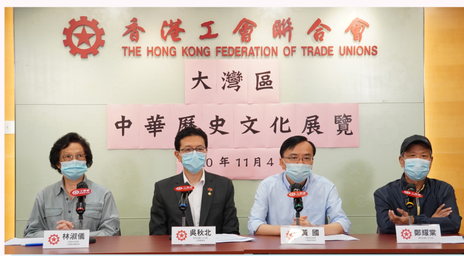
工聯會港區全國人大代表及全國政協委員2020年11月4日舉行記者會，建議中央政府以「共同家園」理念作為凝聚，在大灣區內籌辦展覽，弘揚家國情懷，促進中華歷史文化和人民交流，從而提升國家綜合國力。

對於大灣區而言，有規劃和系統地宣揚中華文化、形成更好的歷史文化共同體，有利於凝聚人心，也是融合發展的基礎。