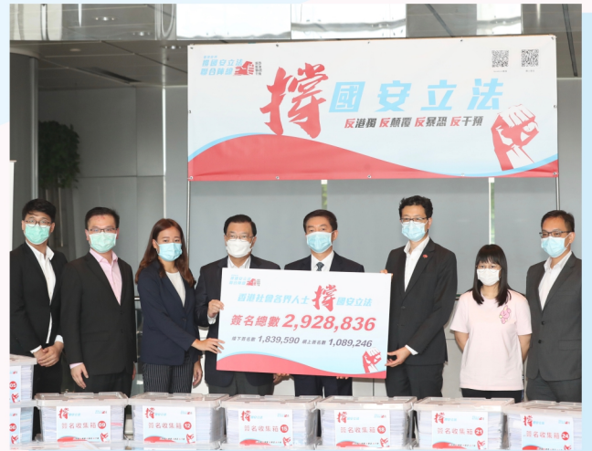
中聯辦主任駱惠寧(右四)出席「香港各界撐國安立法聯合陣線」簽名交接儀式，在為期8日的簽名行動中共收集292萬市民簽名。(右三：吳秋北)