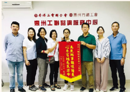
港人感謝內地中心協助。