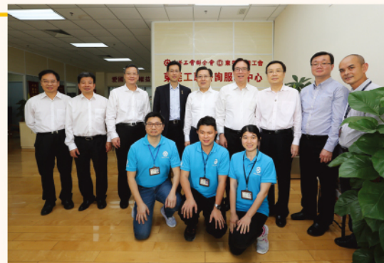
全國人大副委員長王東明到內地中心調研。