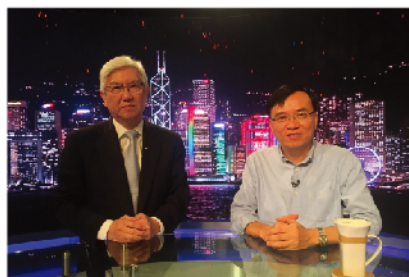
接受鳳凰衛視《時事大破解》節目，講述示威遊行對勞動市場的影響。