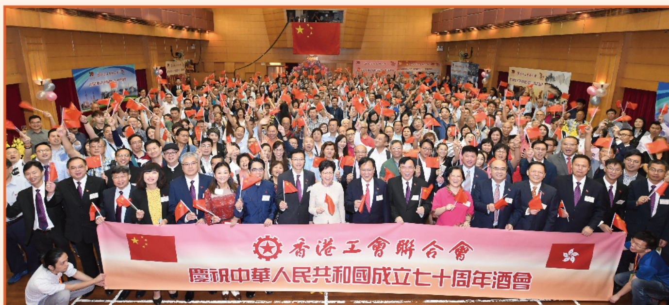
為熱烈慶賀國慶70周年，工聯會9月22日在工人俱樂部禮堂舉行了「慶祝國慶70周年酒會」，邀請到行政長官林鄭月娥、政務司司長張建宗、中聯辦副主任陳冬和何靖等擔任主禮嘉賓。現場逾700名工會及地區代表和友好出席，喜慶洋洋，氣氛熱烈。