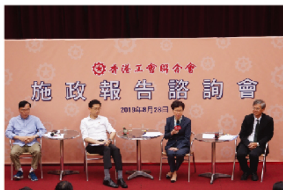
邀約特首林鄭月娥與工友們就施政報告進行「面對面」諮詢會並支持特區政府依法施政。