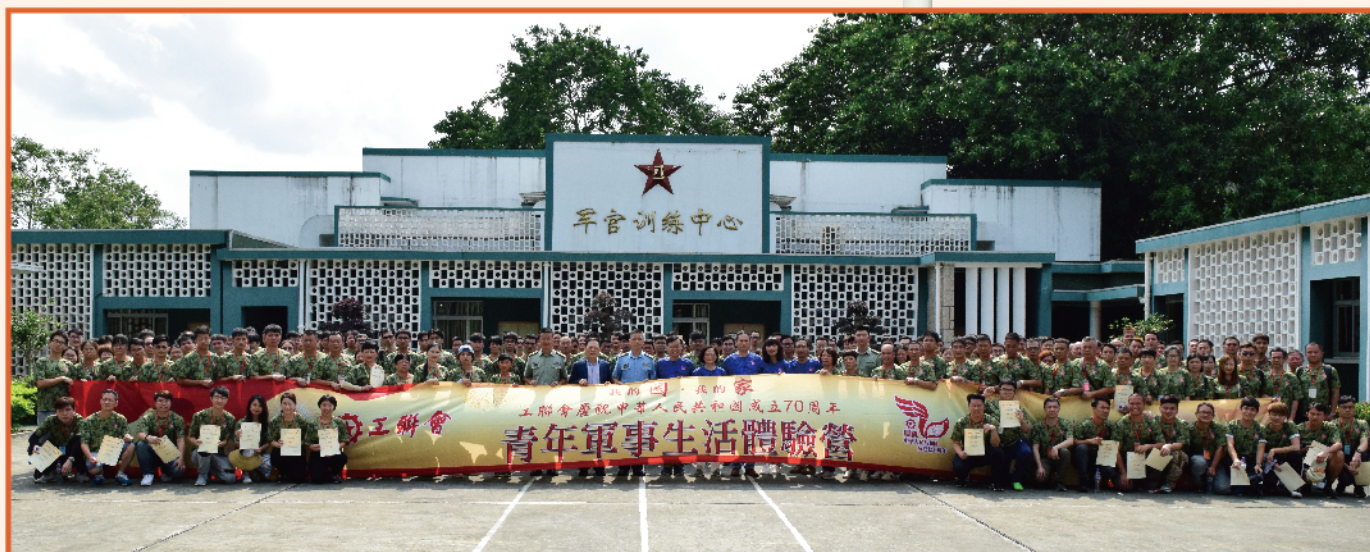
工聯會舉辦「我的國·我的家」青年軍事生活體驗營。200名青年在一連兩日的體驗營中，透過豐富多彩的活動，磨練了意志，加深了對解放軍駐港部隊的認識，亦提升了作為中國人的歸屬感和自豪感。