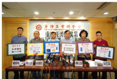
舉辦多場記者會講述現時暴力衝擊對香港經濟的影響，並約見政務司司長表達行業工友對就業情況的意見。