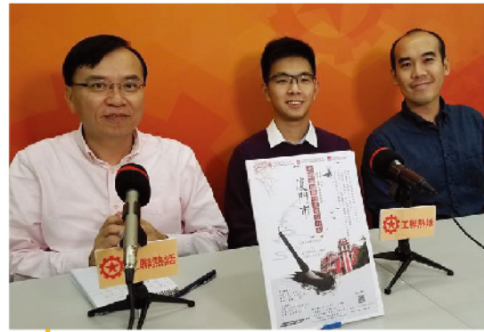
年青人把握大灣區機遇 北上就業創業有前景