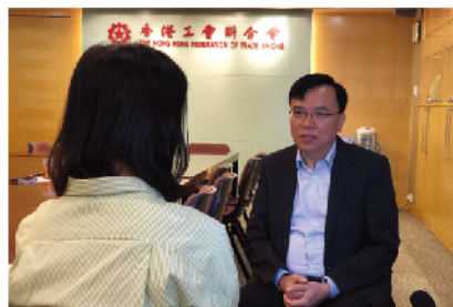
就美國企圖通過《香港人權與民主法案》接受《新華社》訪問發表評論。