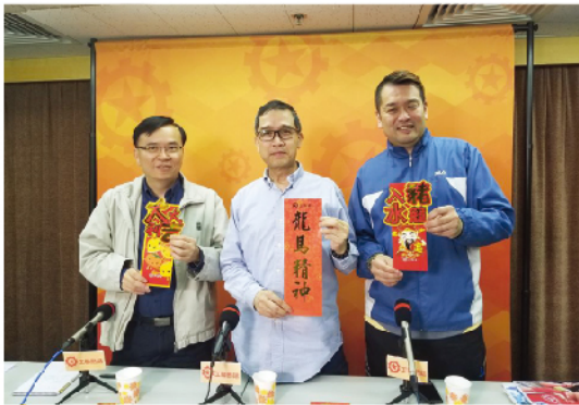
巴士司機與乘客爭執原兇是手機

因應新媒體的蓬勃發展，需要有香港打工仔女的聲音，故此今年也策劃主持了工聯網台，讓各行各業的工友上來發表心聲，就行業打工仔女關心的時事熱點、就業生活、權益訴求以及灣區發展等一系列議題發表聲音，逐一探討。