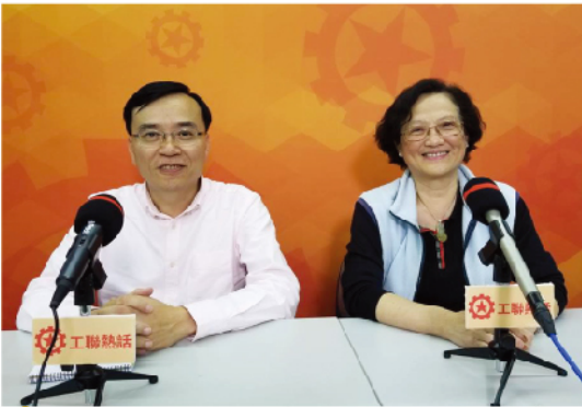
大灣區規劃有利與內地對接 共同打造世界級灣區城市群