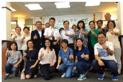
支持香港警方止暴制亂，並為九龍城警署的前線警員送上慰問品。