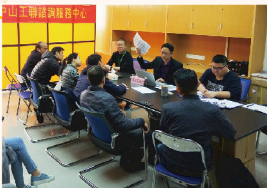
內地中心協助香港業主解決內地問題樓盤問題。