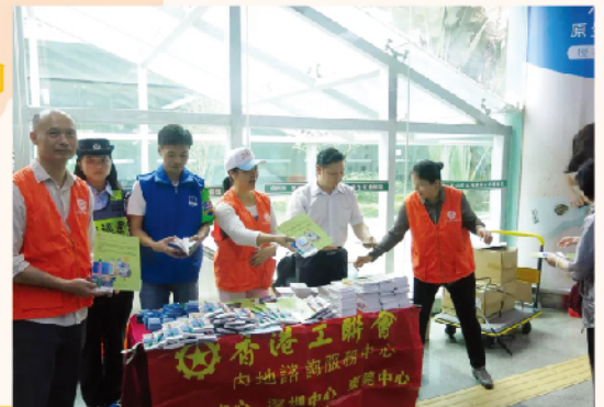
內地中心於口岸開展宣傳活動。