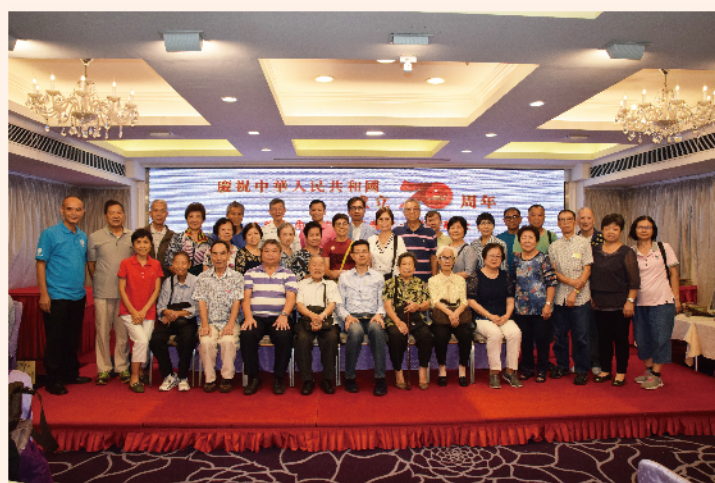
工聯會內地諮詢服務中心9月21日在香港舉行慶祝國家成立70周年暨港人聯歡活動，現場逾550多名港人，共慶國家發展取得偉大成就。

70年來，工聯會一直是祖國發展歷程的見證者、參與者和推動者。多年來，工聯會堅守創會初心，牢記愛國使命，秉持「以打工仔為中心」，「與社會同步 與基層同心」的理念服務廣大市民，不斷推進會務、政務等改革，展現出「與時俱進再創輝煌」的新風貌、新氣象。