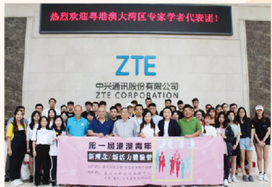
內地中心組織香港青年參觀內地企業。