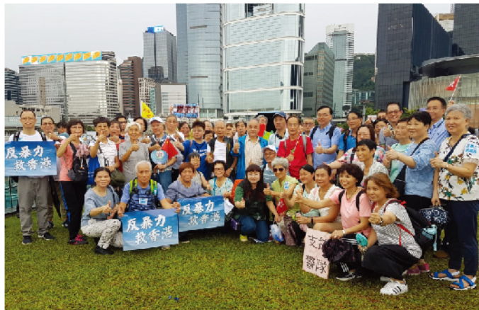
積極參與8.17「反暴力 救香港」集會。

香港持續多月的暴力衝擊，嚴重影響了香港市民的就業和生計，在擔任全國政協委員期間，舉行多次記者招待會，譴責暴力行為對各行各業打工仔女的衝擊。亦多次接受傳媒訪問，講述香港現時止暴制亂的急迫情況。此外，多次就修訂《逃犯條例》進行不同場合的宣講會，參與多場「反暴力 救香港」集會以及對香港警隊多個月來的辛勤執法表達慰問。