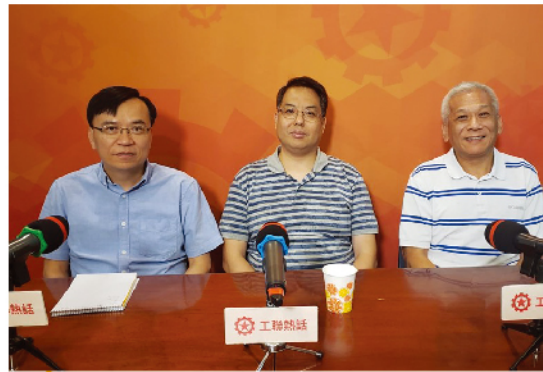
港鐵車長：發動政治性罷工不得人心