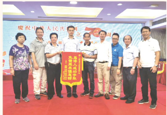
港人感謝內地中心協助爭取香港長者內地免費乘車優惠。