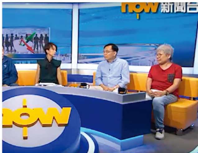
出席《Now TV》時事全方位訪談節目，講述香港未來失業率急升風險有多大。