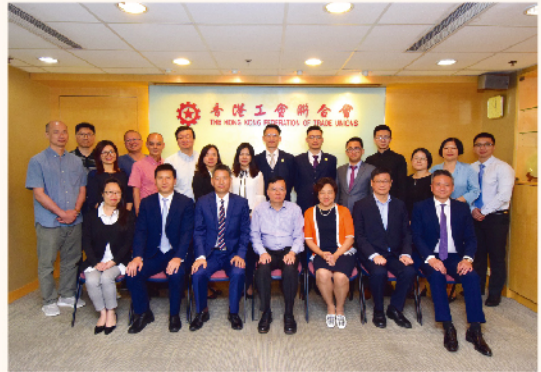
內地中心與律師工作交流。

面對大灣區發展，內地中心將服務與時俱進，就港人旅遊、生活及就學，打工仔女職業發展等，多方面擴展和提升服務而繼續努力。