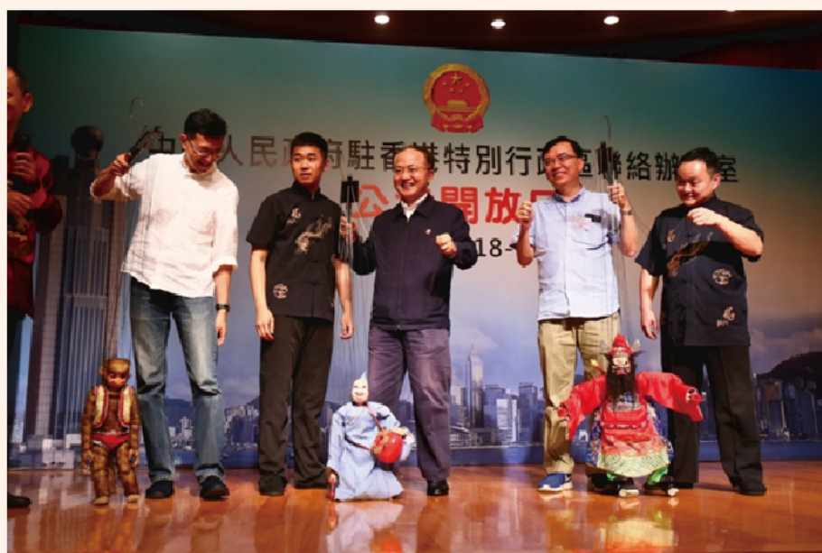
工聯志願服務團超過1500人走進中聯辦大樓參觀訪問，親身體驗中聯辦開放日的各項活動。王志民主任與我們一眾義工和會員觀賞了泉州木偶表演，亦與參加者一同親手學習剪紙，與眾同樂。