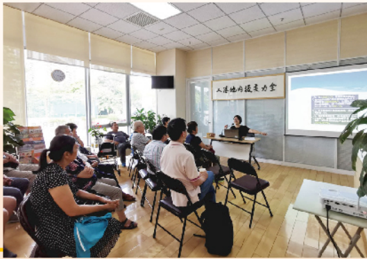
內地中心舉行法律講座。