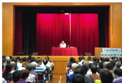
6月以來，多次就修訂《逃犯條例》進行宣講。