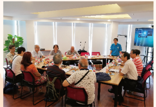
福建中心長者茶聚。