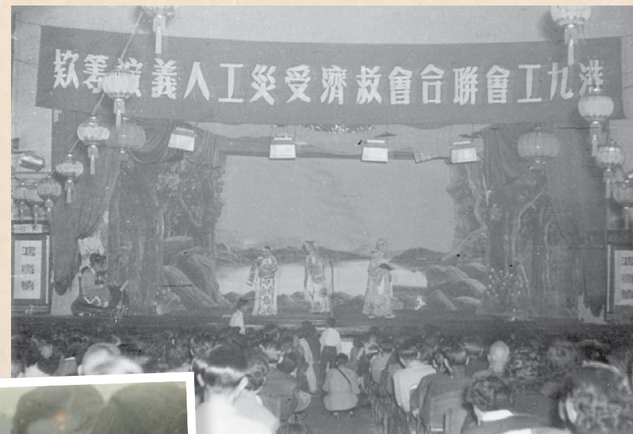
工聯會舉辦義演籌款救濟災工友