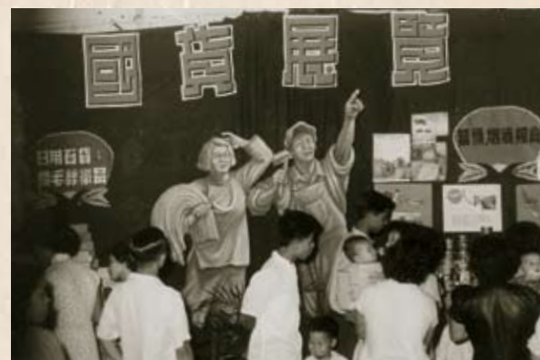
太古工會舉辦國貨展覽