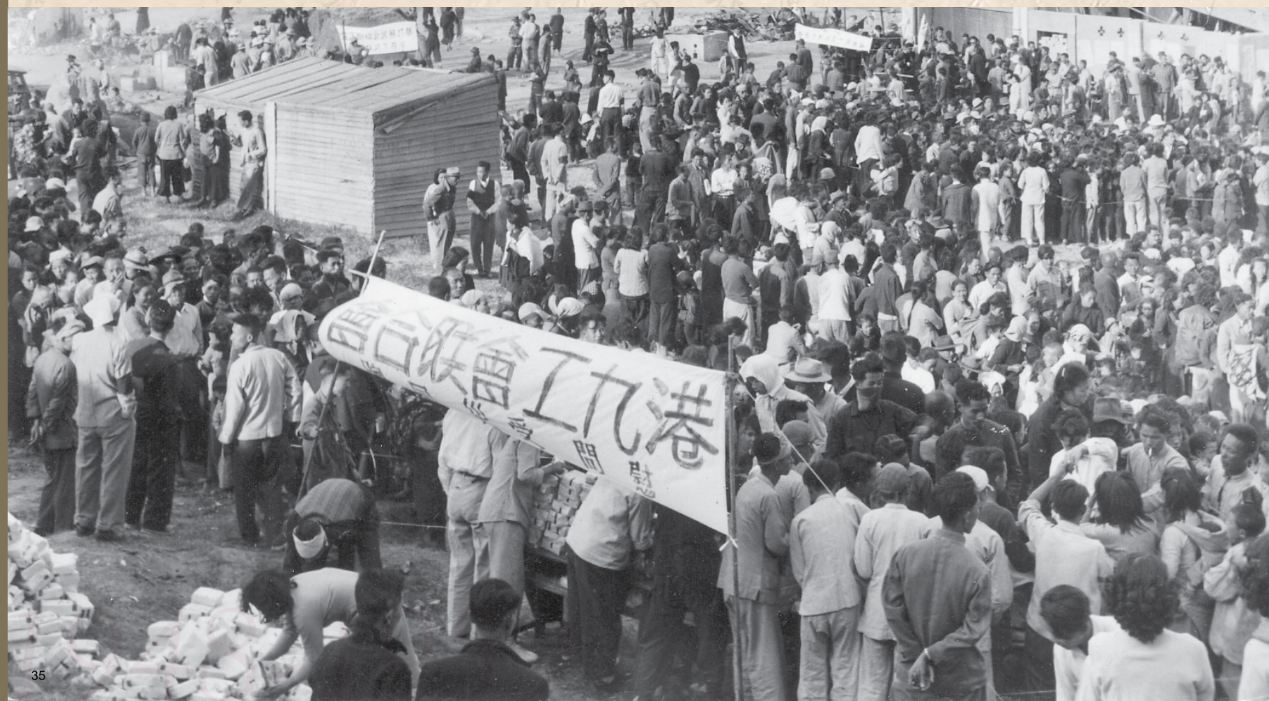
1951年11月23日，工聯會派發餅乾慰問受災同胞。

六村大火 1953年12月25日，深水涉石硤尾等六村發生空前大火，災民6至7萬。中國人民救濟總會粵穗分會及時匯來人民幣10億元（折合港幣23萬多元），送來大米70萬斤。工聯會和中華總商會接受委托，於1954年1月14日，分別在界限街陸軍球場及楓樹街長沙灣球場進行發放。