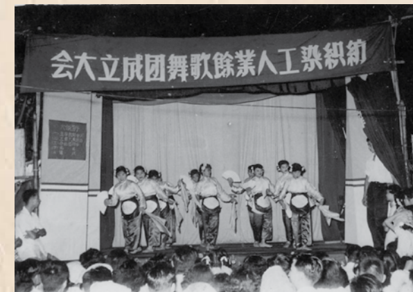
紡織染工人業餘歌舞團成立於1956年5月