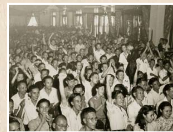
3,000多工人代表為新中國誕生而歡欣鼓舞