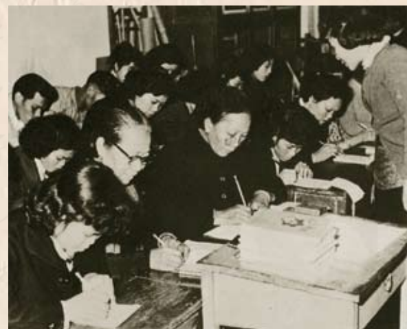
工人上夜校學文化