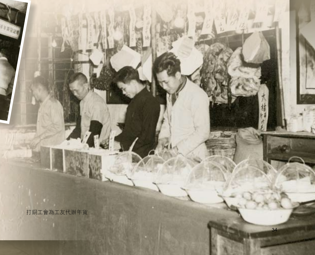
打銅工會為工友代辦年貨