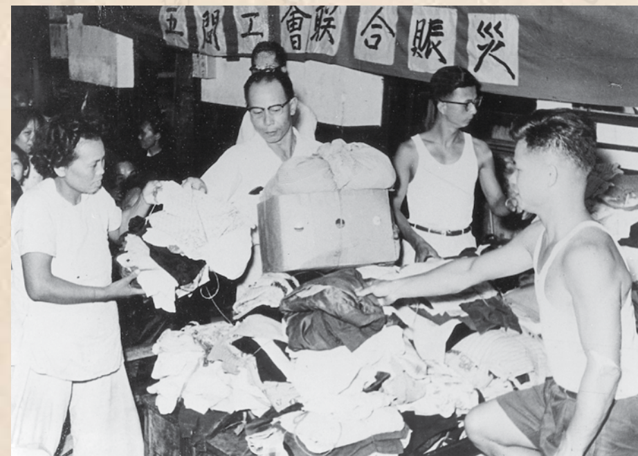
五間工會聯合賑災，工會工作人員協助派發賑災物品。