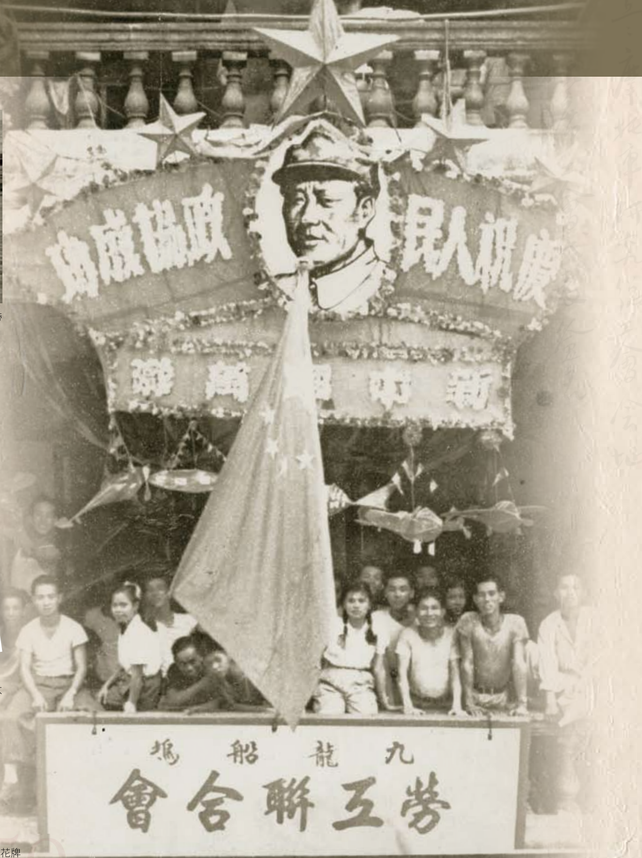
工聯屬會九龍船塢勞工聯合會掛起慶祝政協成立的花牌