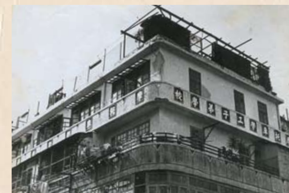
「摩托車勞工子弟學校」是五間規模較大的勞校之一