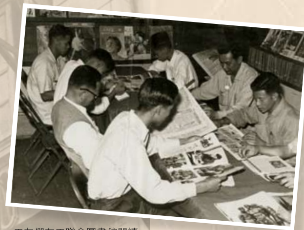
工友們在工聯會圖書館閱讀

工聯會發起「設館建會」運動，三個月的工作兩個月完成，辦起了兩間圖書館，工聯會也在灣仔駱克道142號4樓有了自己的會所。