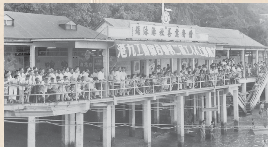
1957年，工聯會在西環鐘聲泳場舉行第二屆水上運動會。