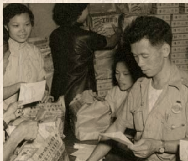
摩托總會九巴分會辦的月餅會