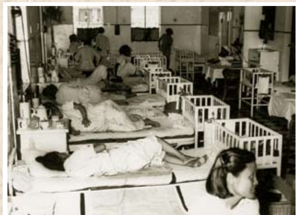
昔日不少產婦選擇工聯會所設之留產所分娩