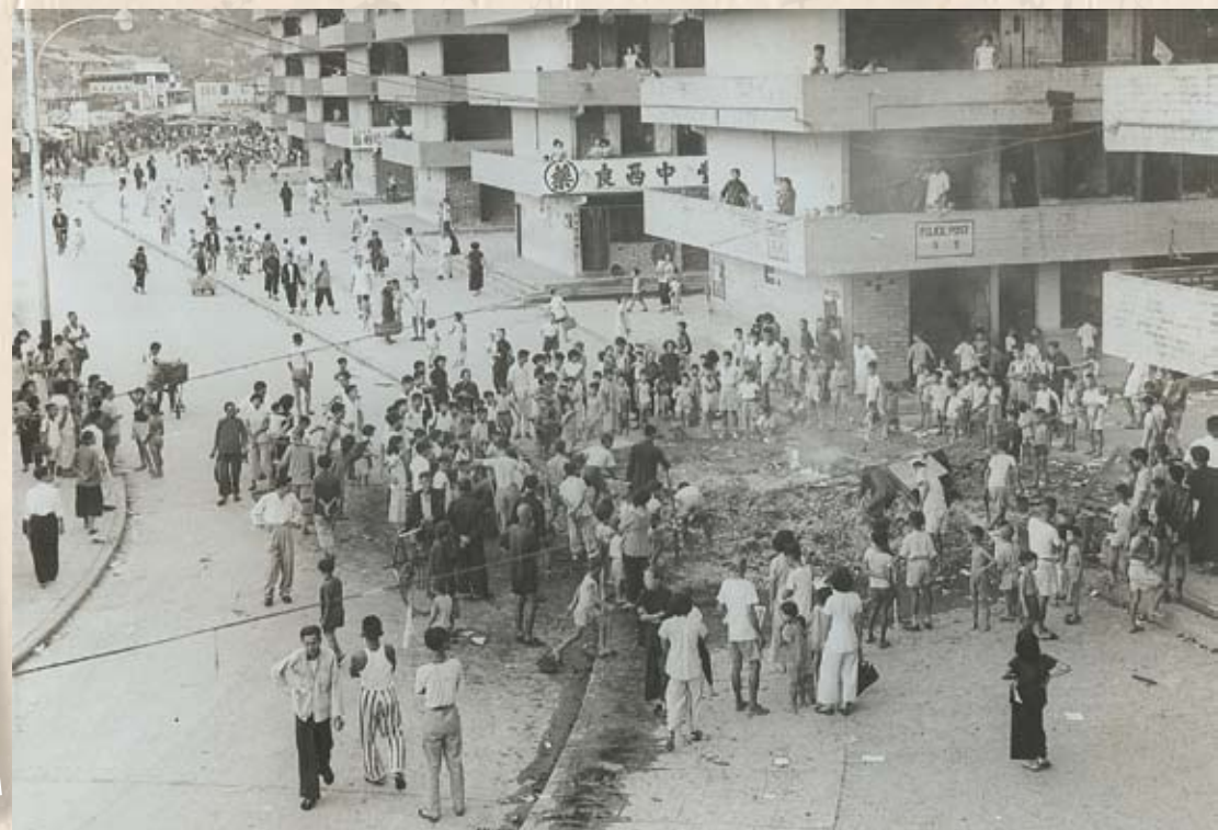
九龍暴亂肇事中心點在李鄭屋邨和石硤尾兩個徙置區