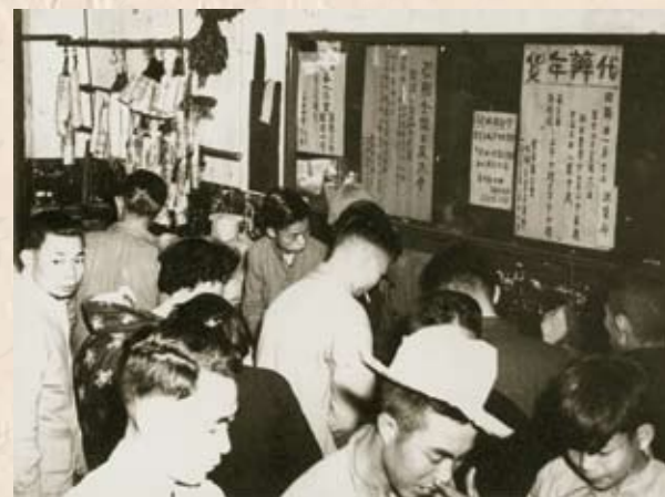
電車工會為工友代辦年貨