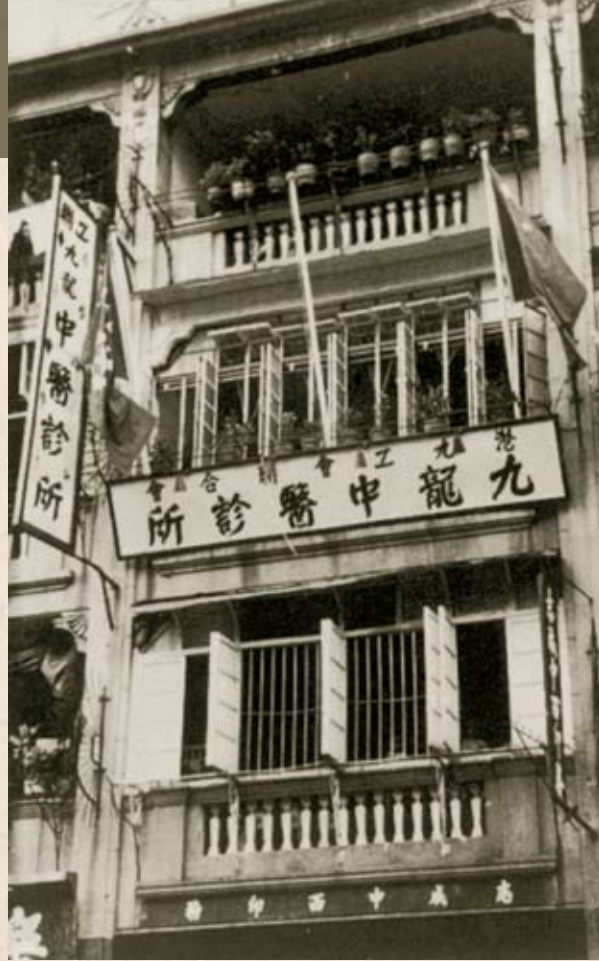
1955年5月29日在九龍開辦的第一間中醫診所