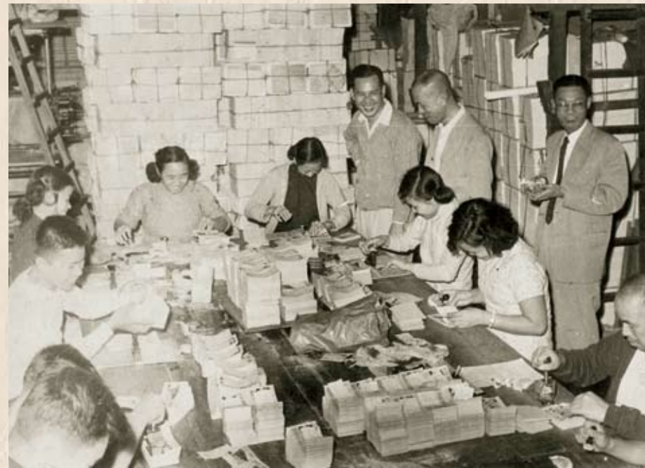
籌委會在一天內發出五萬捐冊，印務工人義印捐冊，加緊釘裝。