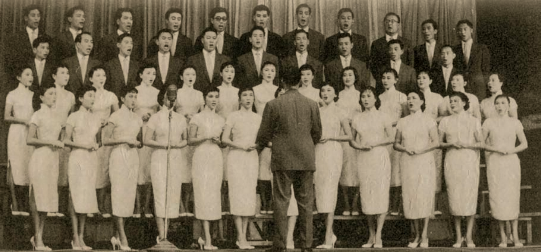
為籌建工人大會堂，工聯會於1958年12月13日，在香港大舞台主辦國粵語影星聯合大會演。