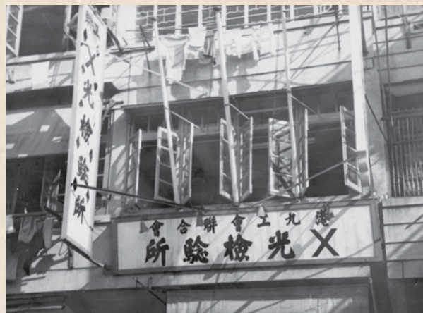
1952年1月20日，X光檢驗所開幕