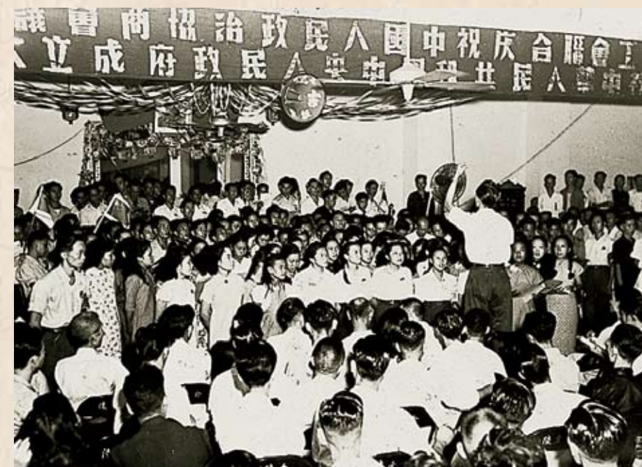
工聯會於1949年10月2日，在金陵酒家舉行慶祝中華人民共和國中央人民政府成立大會。工人代表在慶祝大會上縱情歌唱。

香港工人具有淵源深遠的愛國傳統，工聯會從成立那一天起就將工人的利益同自己國家和民族的前途緊密連在一起。香港工人為新中國的誕生歡呼，支持兩航起義、支援解放海南島，支援祖國建設。