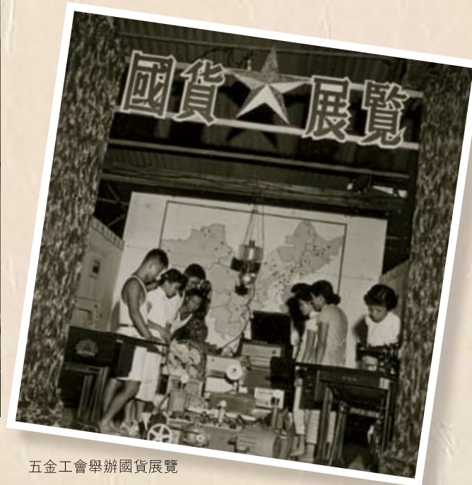
五金工會舉辦國貨展覽