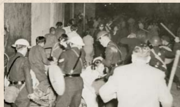
警察用警棍和手槍攻擊赤手空拳的工人，導致28人重傷，電車工會亦遭到嚴重的破壞。