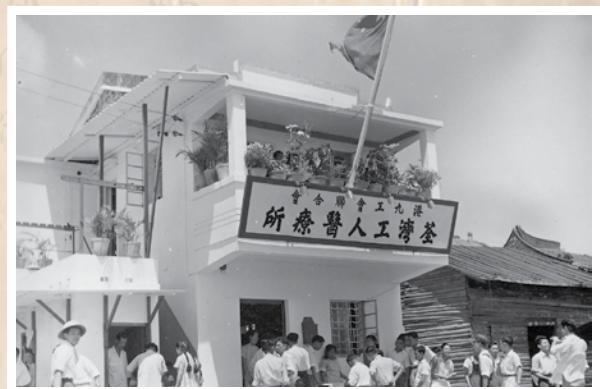
1952年5月，成立荃灣工人醫療所。

工人醫療所建立起來後，工會即辦起家屬醫藥津貼，每次看病津貼2元，一年12次，如患有肺病或頑疾，可另增加至24次；婦女生育有補助金（當時留產所收費是20元），會員添丁，工會送20元賀金。