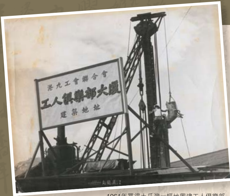
1961年買得土瓜灣一幅地興建工人俱樂部