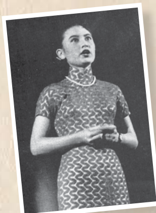
影星石慧小姐獨唱（1955年）