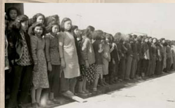
南洋紗廠爭取年賞 1949年1月22日，南洋紗廠工人為抗議資方減發年賞而停工。1月25日，工聯會和14間屬會代表前往慰問，給予支持。最後工人獲得每年一個月年賞。圖為女工們接受慰問的情形。