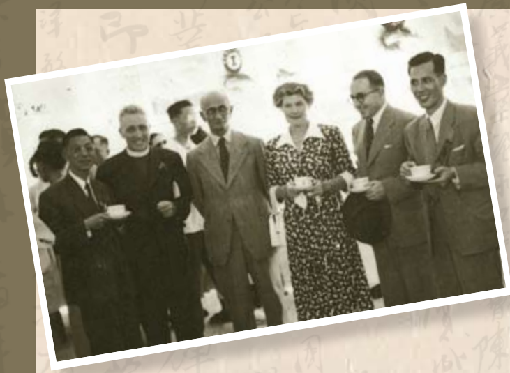
1951年4月29日，旺角勞工子弟學校新建校舍舉行開幕禮，由港府教育司高詩雅主持啟鑰（右起勞教會副主任麥達德、高詩雅及其夫人、律敦治、何明華會督）。