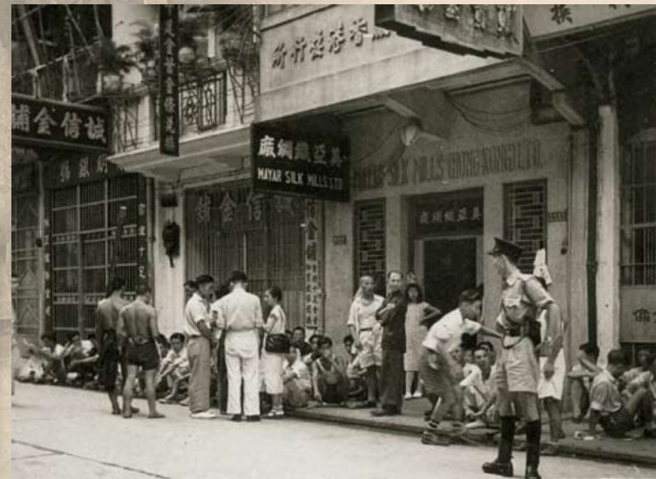
美亞織網廠工友罷工 工友因反對資方無理要求及抗議資方開除工會負責人而罷工。在工聯會及各屬會的支援下，從1949年5月25日罷工至8月14日勝利復工，300多人堅持了80多天的鬥爭。