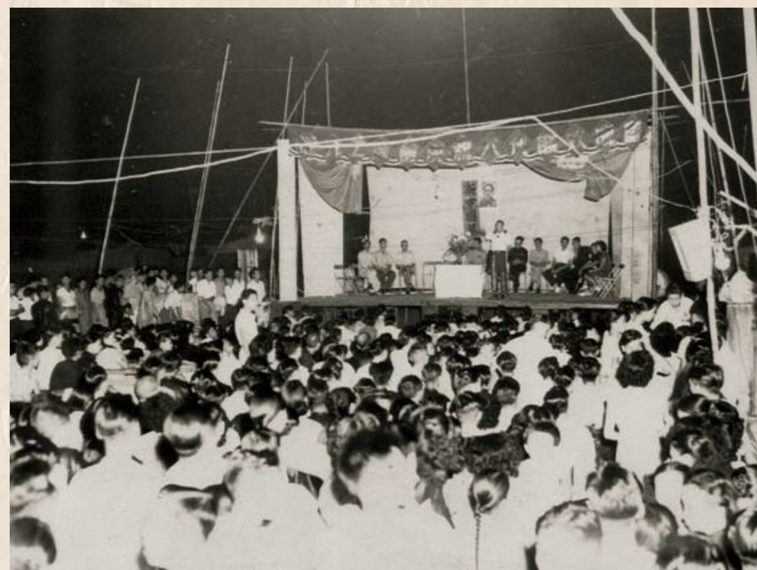
工聯會在駱克道142號天台舉行慶祝入伙聯歡晚會的情景