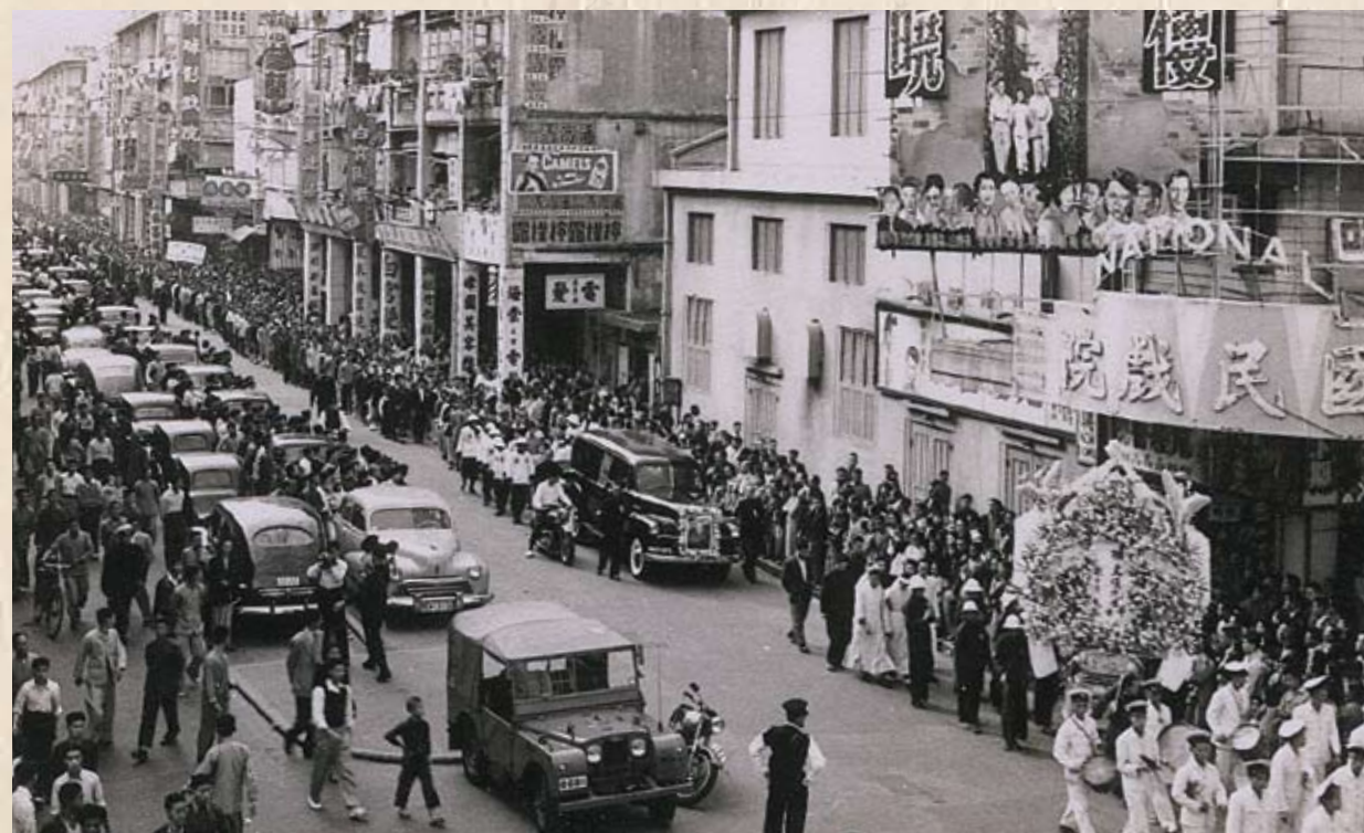
陳文漢理事長因肺病在任內逝世。1953年11月27日出殯時，沿路群眾萬人空巷，哀悼失去一位勤勞卓越的工運前輩。