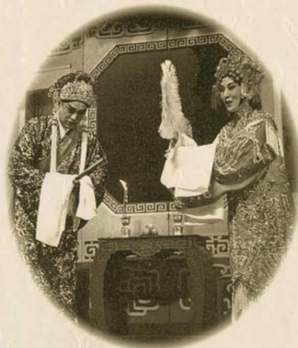
著名演員張活游先生和梅綺小姐合演《柳毅傳書之洞房》（1959年）