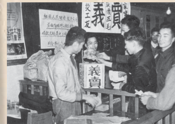
工聯會為救濟災工友義賣