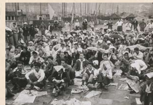
1950年元旦，在工聯會天台開大會，用報紙鋪地而坐。

1949年9月27日遷到灣仔駱克道142號4樓，直至1964年8月28日工人俱樂部建成後工聯會才有了固定會所。