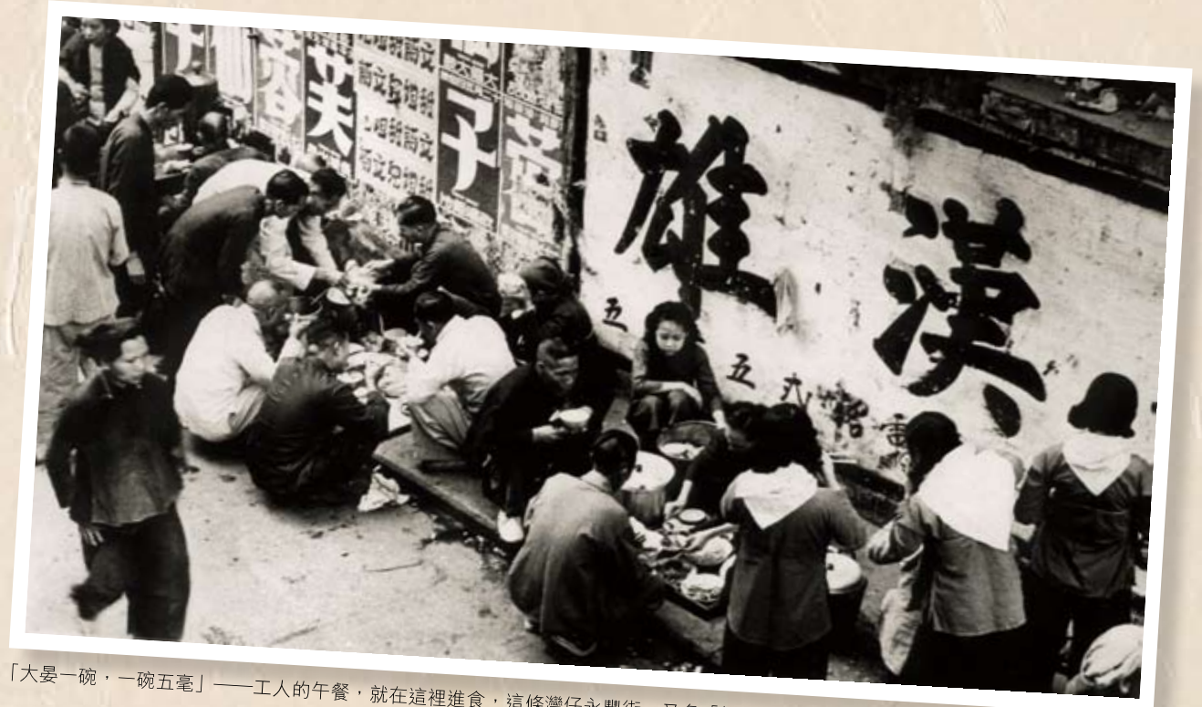
「大晏一碗，一碗五毫」——工人的午餐，就在這裡進食，這條灣仔永豐街，又名「鐸地工人食街」。

戰後香港，糧食配給，日用品管制，物價飛漲；近三分之一樓宇毀於戰火，勞苦大眾無處棲身；失業嚴重，人工低賤，每天做足12小時始僅夠糊口，工人處於極度貧困之中。