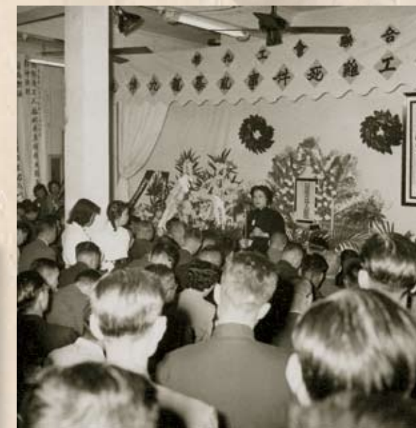
12月2日，工聯會舉行「追悼九龍暴亂事件死難工人同胞大會」。