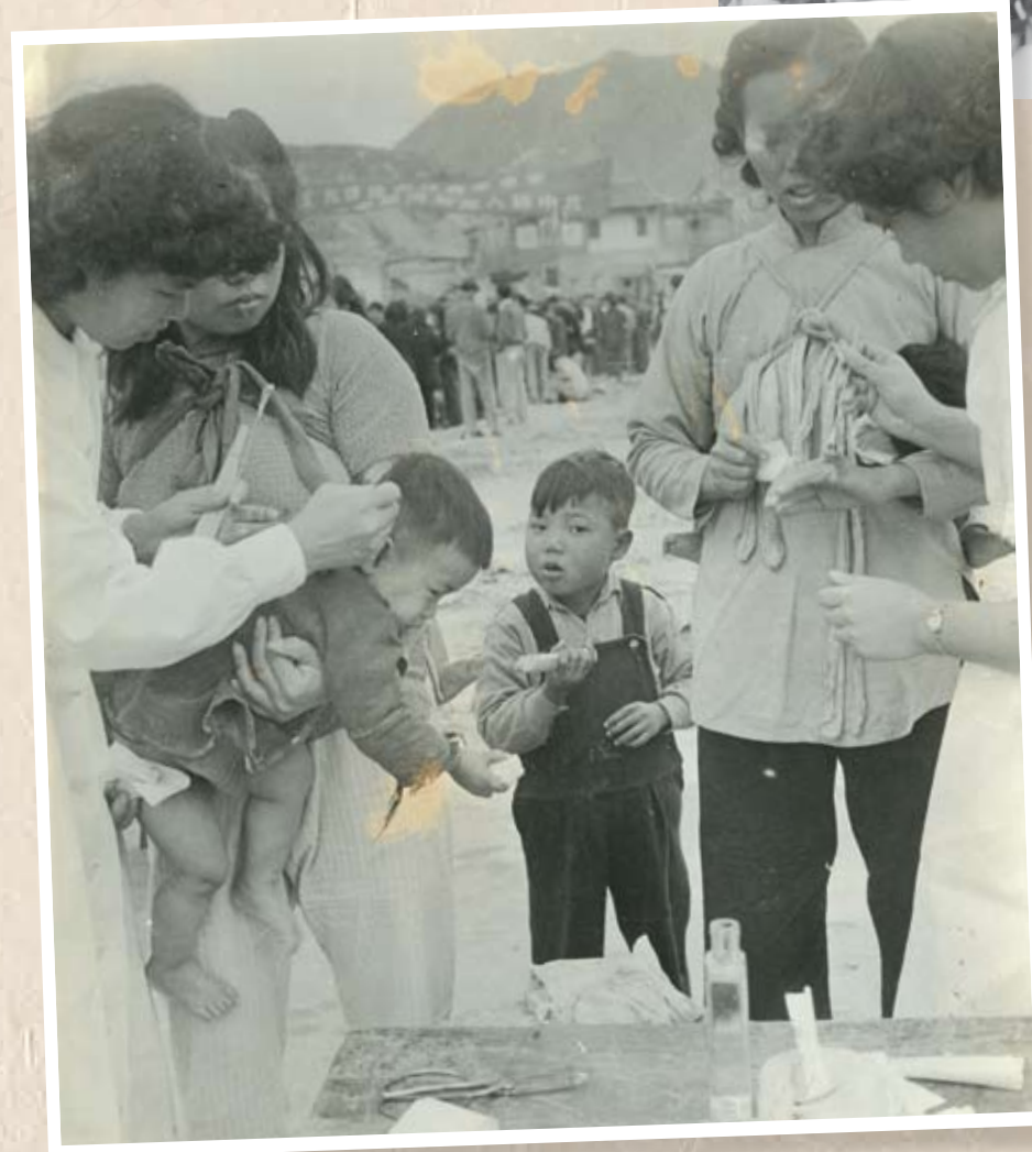
工人醫療所的醫護人員在災區為傷者敷藥