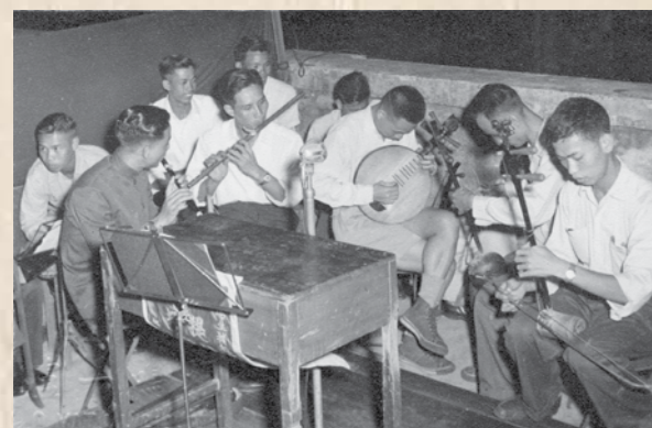
五十年代生豬工會的中樂組在天台演奏