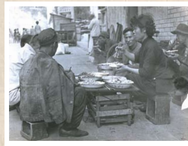
午間放工時工人大多到街邊小飯檔食飯，兩毫子一餐，餸不夠，唯有「加多啲汁」。