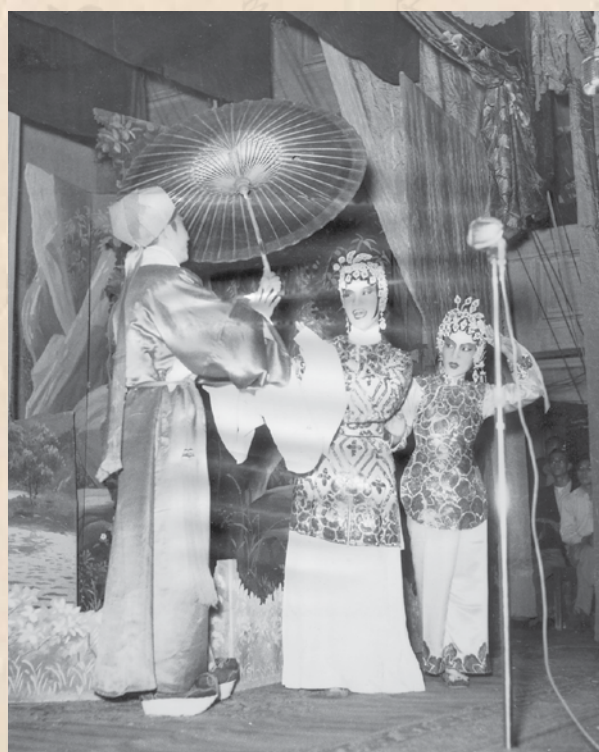
1956年為工聯會賑災義演《白蛇傳》

工人業餘粵劇團 成立於1956年，曾改名為「南國粵劇團」，頗具規模，演出過《白蛇傳》、《柳毅傳書》、《搜書院》、《信陵君救趙》、《花木蘭》和《拉郎配》等傳統劇目，拍過一部電影《喬老爺上花轎》。