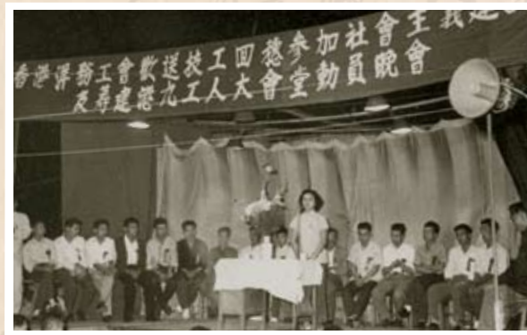
洋務工會歡送技工回穗

技工回國建設 1958年，在祖國社會主義建設高潮鼓舞下，近萬名香港技術工人回內地參加國家建設，把技術獻給祖國。