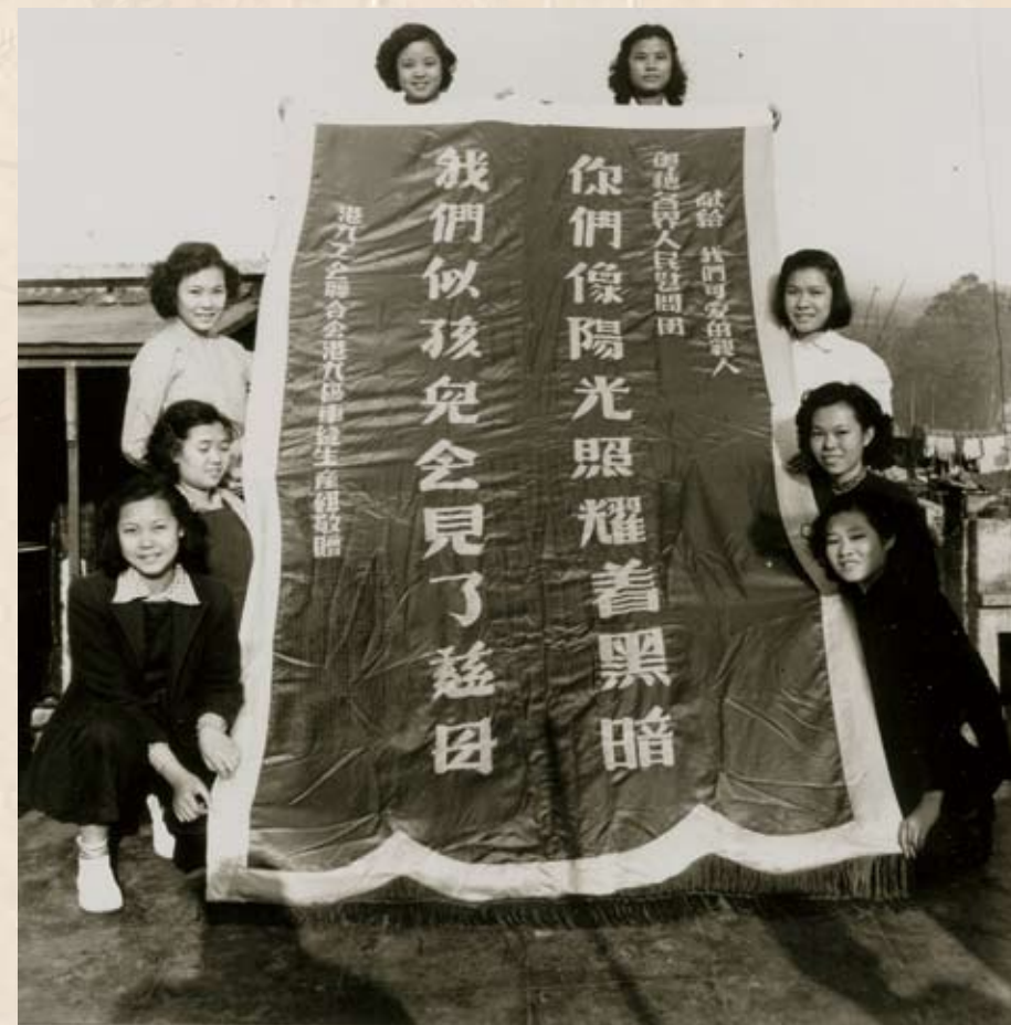
工友準備贈送給慰問團的錦旗

1952年，粵穗各界為慰問東頭村大火災民，組成粵穗慰問團，定於3月1日來港，卻遭港英當局拒絕入境，尖沙咀聚集的歡迎群眾散去時，在彌敦道發生了流血事件。事後當局企圖控告工聯會，在工聯會的據理駁斥下，才告中止。