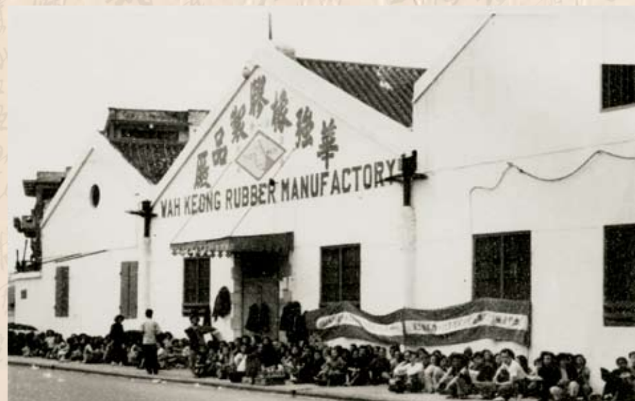
華強膠廠工友靜坐要求復工 1952年2月，華強膠廠拒發年終津貼，全面減低工資，要全廠工人「重新登記，量才錄用」，變相開除工人，600多工人在廠門外靜坐要求復工。

海塢閉廠鬥爭 1957年11月，香港海軍船塢突然宣佈兩年內關閉，解僱全廠4,600名員工，政府宣稱不會負責安置員工職業。工聯會及各工會成立支援委員會，各業工人40多萬人簽名支持。海塢員工堅持了20個月的說理鬥爭，直至1959年6月終於爭取到員工就業和補償。