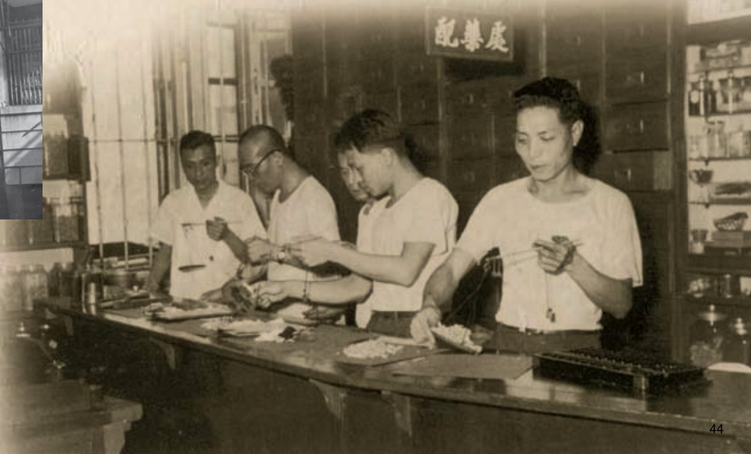
50年代中醫診所掌櫃為工友調配中藥