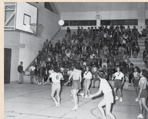
紡織染工會女子隊對新青女子籃球隊比賽