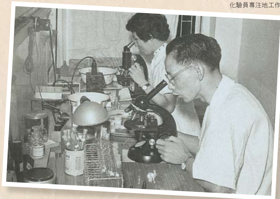
化驗員專注地工作