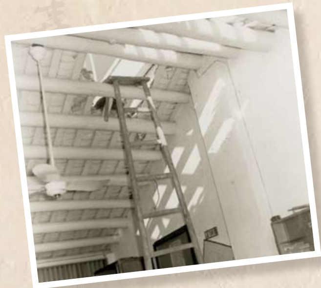
暴徒用梯攻入荃灣工人醫療所