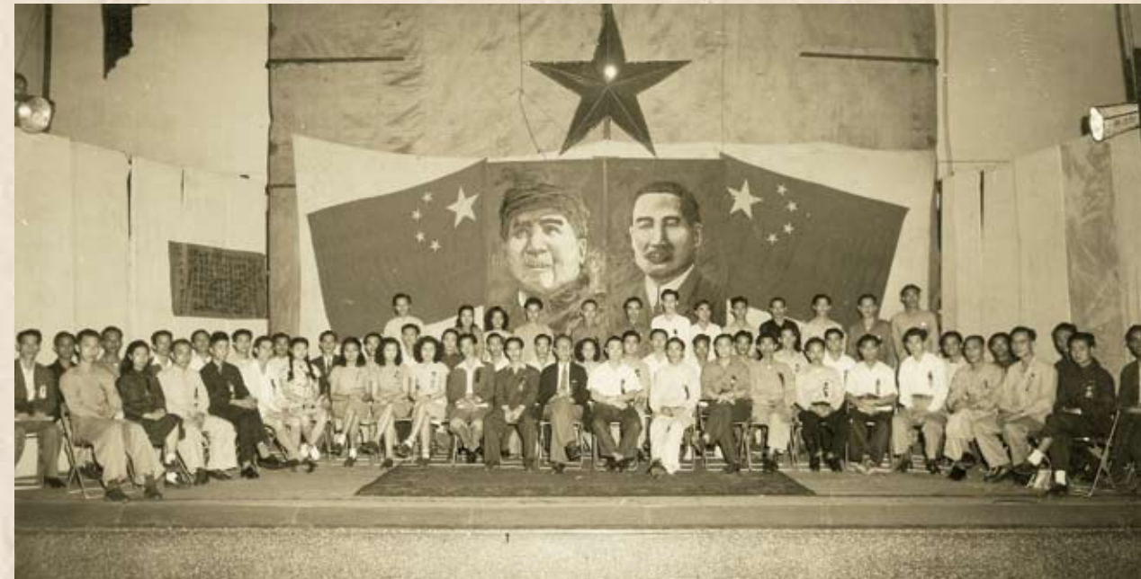
第三屆理事就職典禮於1950年4月16日在高陞戲院舉行