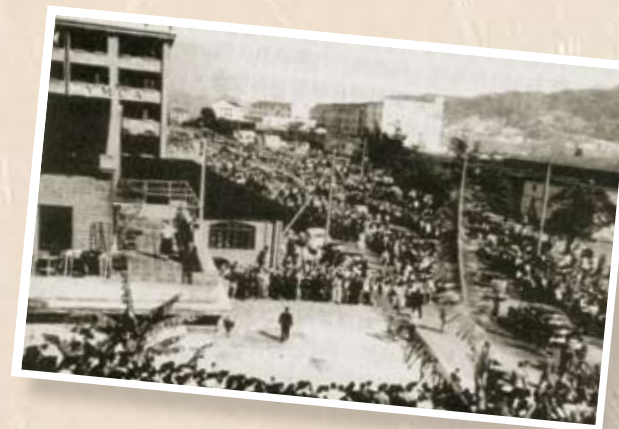
3月1日在尖沙咀準備迎接粵穗慰問團的群眾