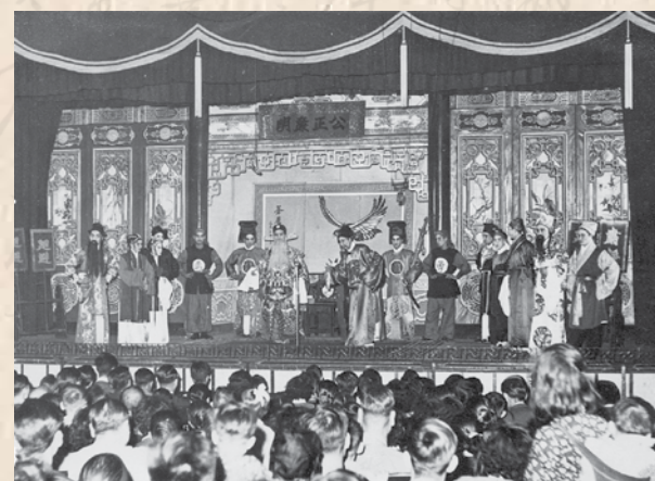
1957年義演《拉郎配》籌募勞校經費

工人業餘粵劇團 成立於1956年，曾改名為「南國粵劇團」，頗具規模，演出過《白蛇傳》、《柳毅傳書》、《搜書院》、《信陵君救趙》、《花木蘭》和《拉郎配》等傳統劇目，拍過一部電影《喬老爺上花轎》。