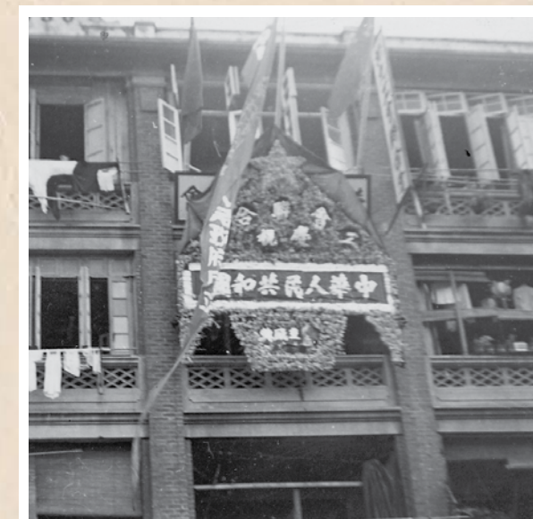
1949年10月1日新中國成立，工聯會在駱克道會所外掛出了第一面五星國旗。