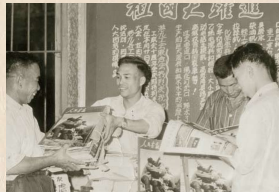
工聯會推動各業工友訂閱《人民畫報》(1958年)