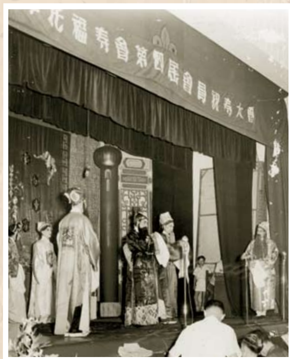
五十年代，工會創辦福壽會。通過共同儲蓄，令回鄉養老的工友有筆生活補助費，仙遊的工友家屬有帛金料理喪事，不致徬徨。圖為摩托福壽會的會員祝壽大會。