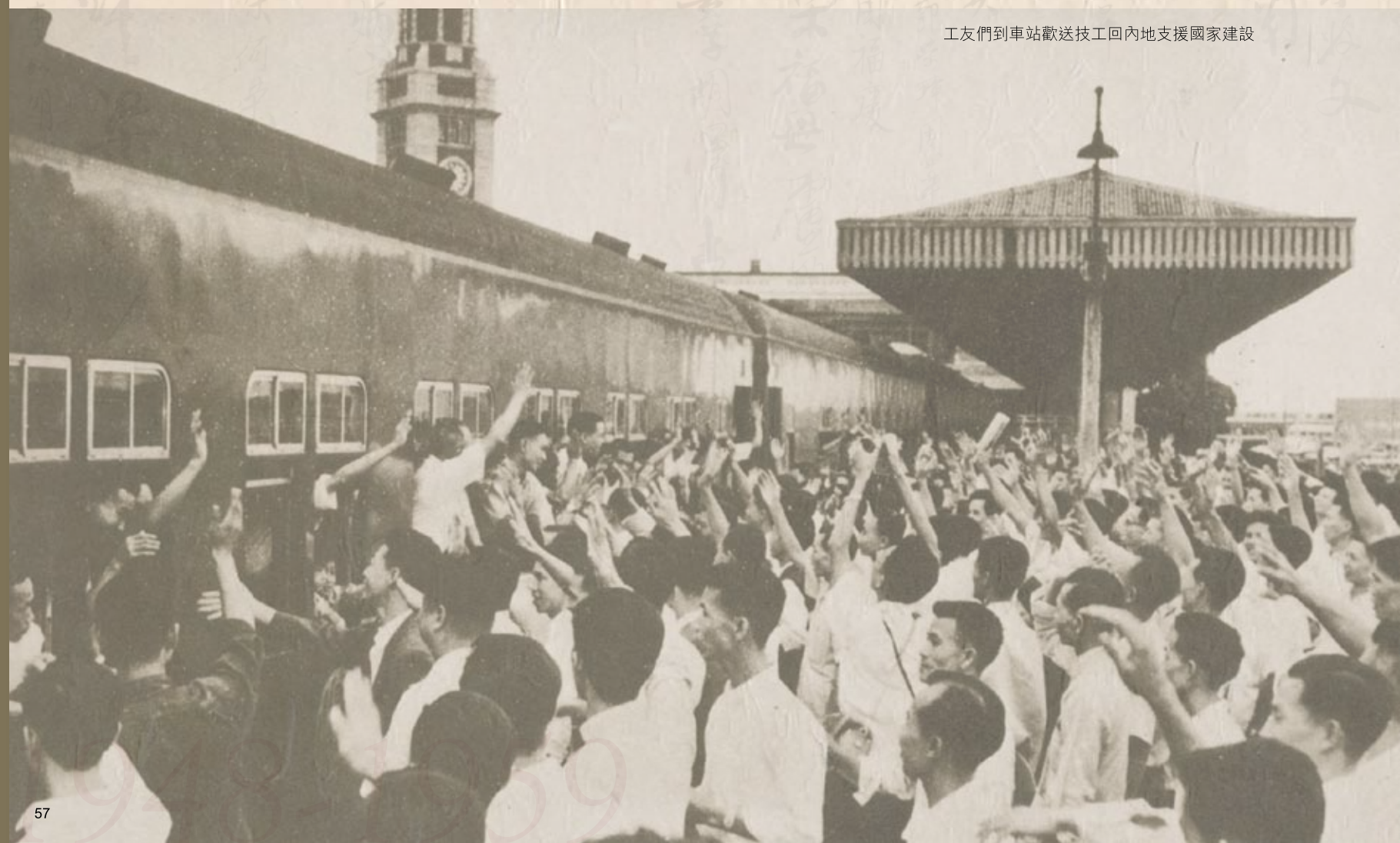
工友們到車站歡送技工回內地支援國家建設