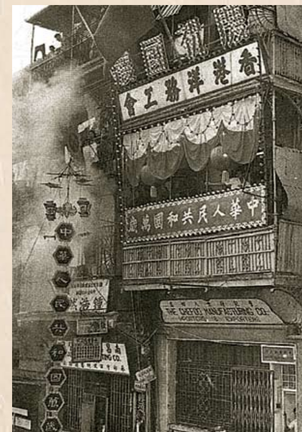
歡慶新中國誕生，洋務工會燃放炮竹，慶祝國慶。