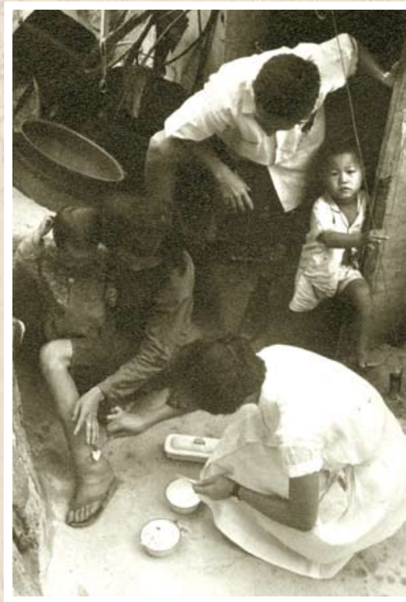
醫療所護士為災民清洗傷口換藥