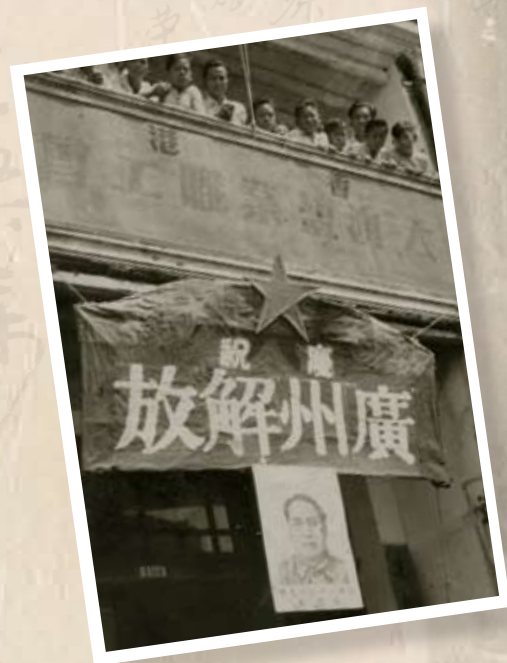
1949年10月15日廣州解放，工聯屬會香港大澳鹽業職工會慶祝廣州解放。