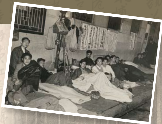
1949年12月11日，德和輪工友在經理的住宅外露宿請願。