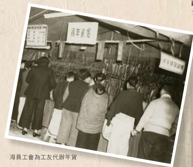
海員工會為工友代辦年貨