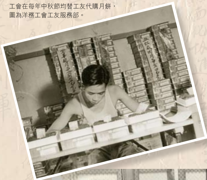
工會在每年中秋節均替工友代購月餅，圖為洋務工會工友服務部。