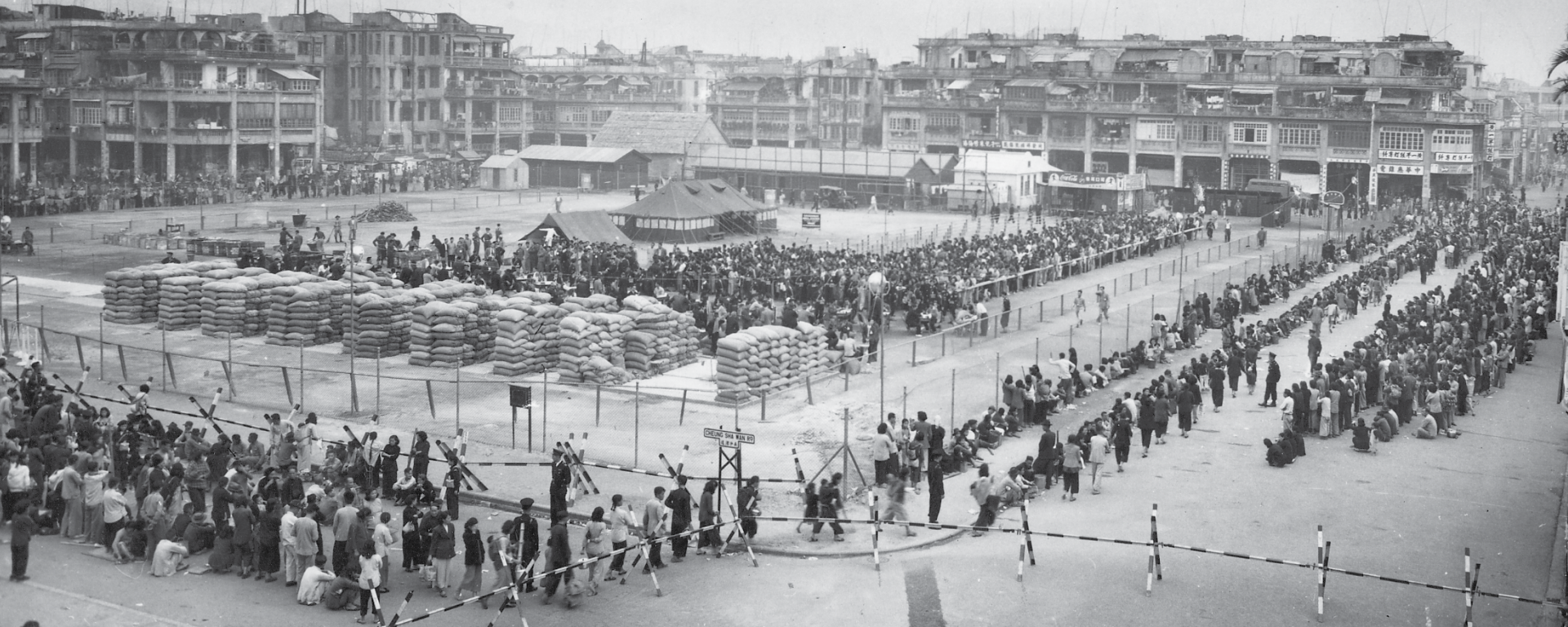
發放救濟米前夕的界限街陸軍球場，堆放著一包包來自祖國的白米。