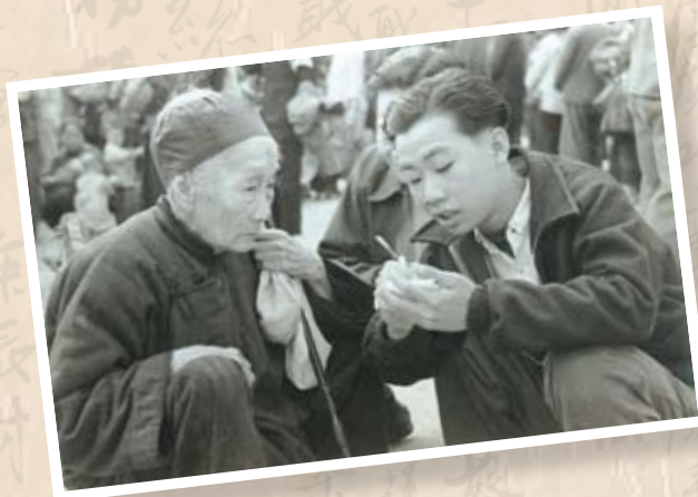
工會工作人員正為災民登記

東頭村大火 1951年11月21日東頭村大火，災民16,000多人，工聯會在災後第二天就開會決定翌日在災場派發餅乾5,000包慰問受災同胞。