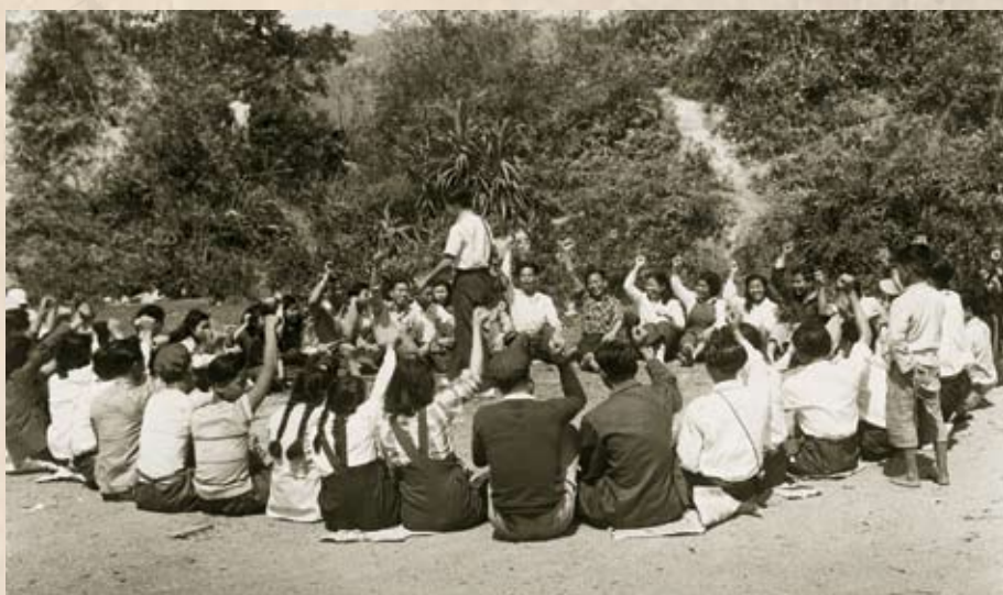
1950年2月5日，中華人民共和國成立後第一個春天，工聯會舉辦青工大旅行（沙田紅梅谷）。