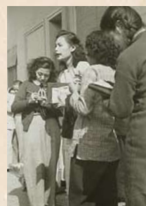
婦職工會代表講話，抗議緯綸紗廠資方所為。