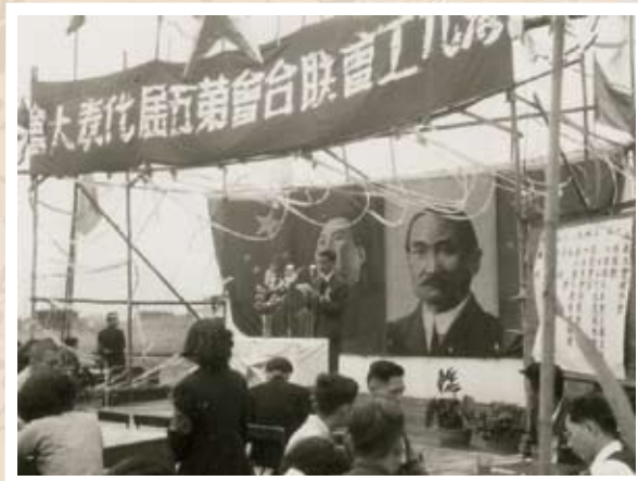
第五屆代表大會於1952年4月13日在工聯會天台舉行