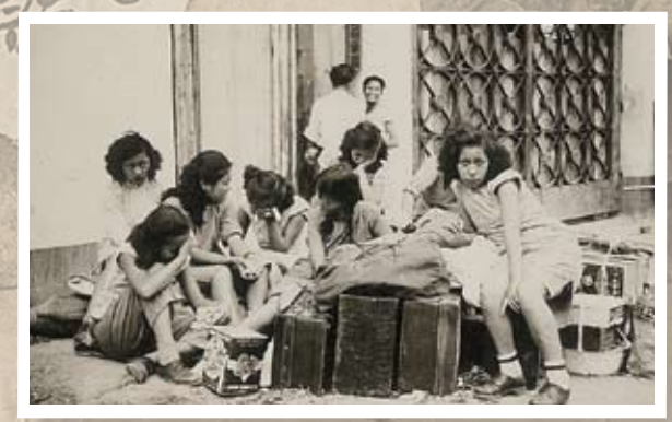
緯綸紗廠工友被無理開除 工友因紀念「五·一」被資方無理開除，跟隨資方南下來港女工的行李被廠方拋出街外。