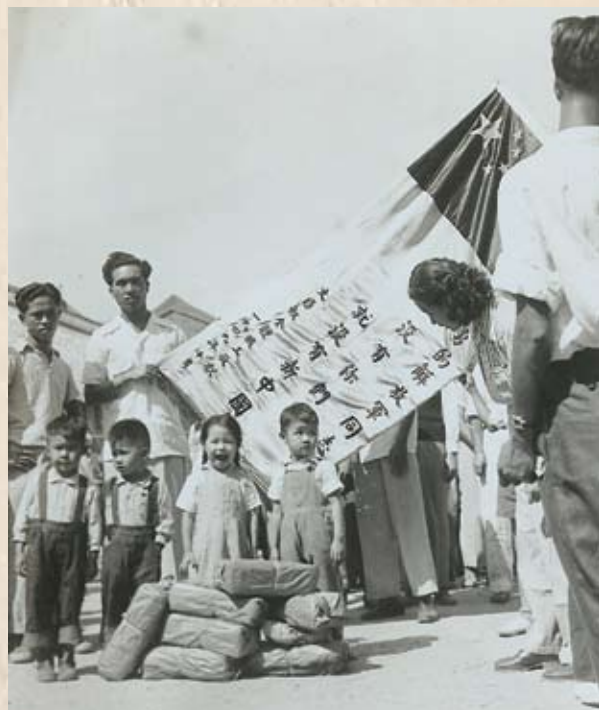
小朋友也來深圳勞軍