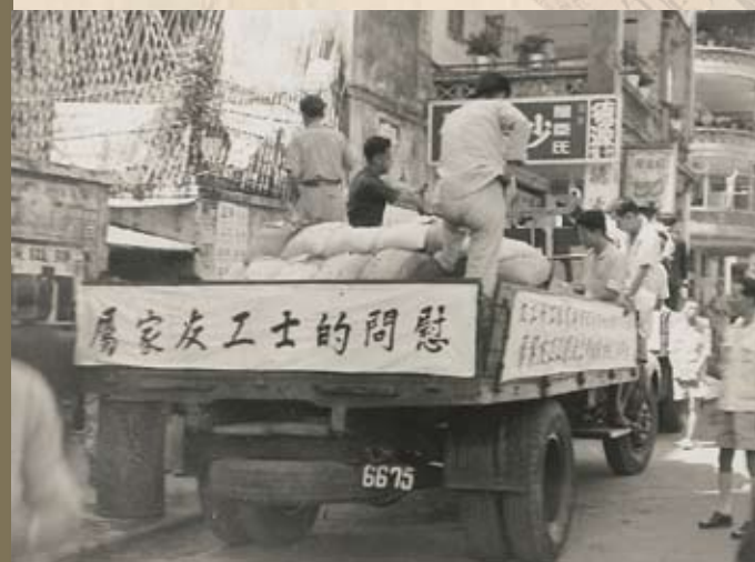
各業工人送糧款及物品慰問的士罷工工友