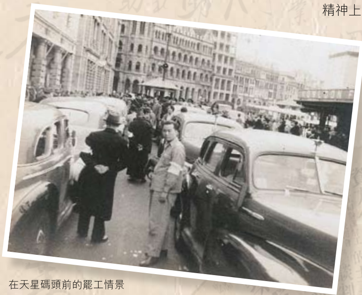
在天星碼頭前的罷工情景

的士罷工 1948年9月，八間的士公司的工人為爭取合理的工資待遇而發生工潮，持續了124天。工聯會發動屬會發揚團結互助精神，在經濟、物質及精神上給予大力支持，並力促有關方面調處協助，解決了這場勞資糾紛。