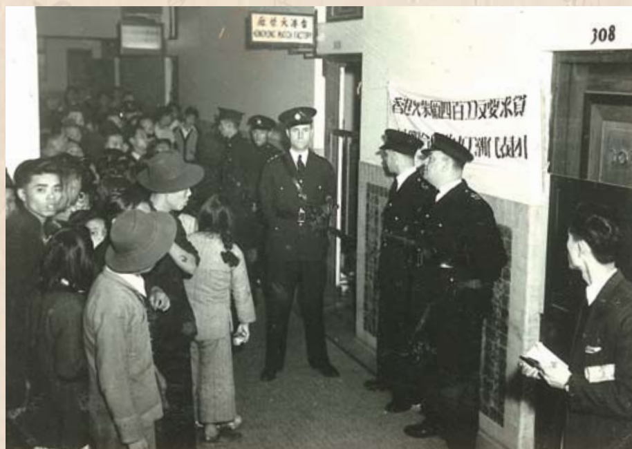
火柴廠資方召警迫害工人