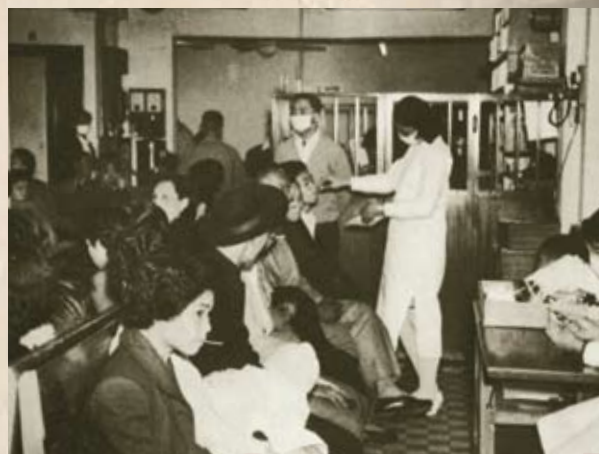
工友在醫療所就診