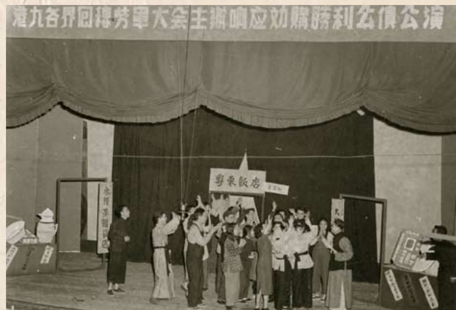
工聯會於1949年1月12日率先認購勝利公債11,000份 (1份 = 50多元)