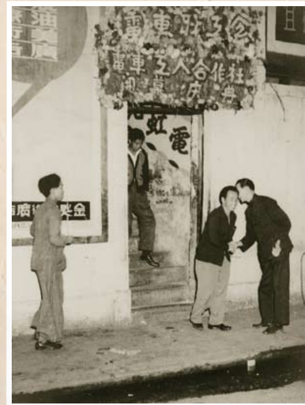
位於鵝頸橋的電車職工會電車工人合作社開幕慶典