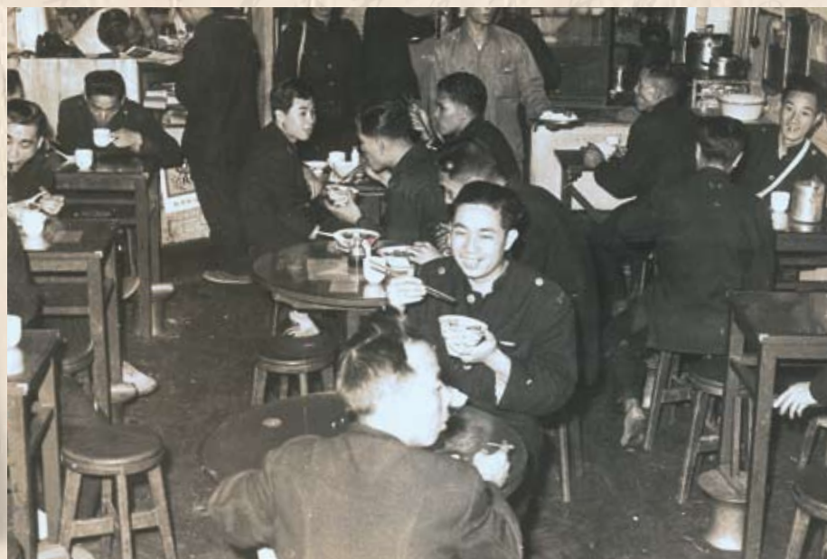
位於灣仔軒尼詩道與堅拿道東之電車工會飯堂

為減輕工人負擔和生活上的困難，工聯會各屬會普遍辦起食堂，為工友節省吃飯開支；而服務部及小賣部的設立，除為會員群眾提供經濟實惠的日用品外，還代辦年貨，代購月餅等。有些服務部如電車工會還在站頭為開工工友送飯送水。海員工會的飯堂，每餐每位八毫，失業會員每位只收五毫，有菜有湯一鹹味，白飯任食。