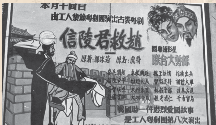
1958年為籌建工人俱樂部義演《信陵君救趙》