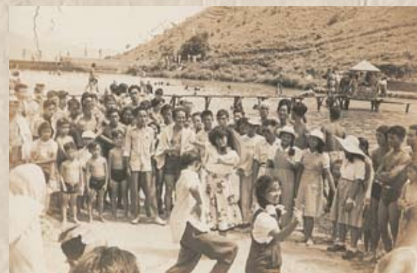
九龍船塢勞工聯合會在鑽石山的旅遊活動