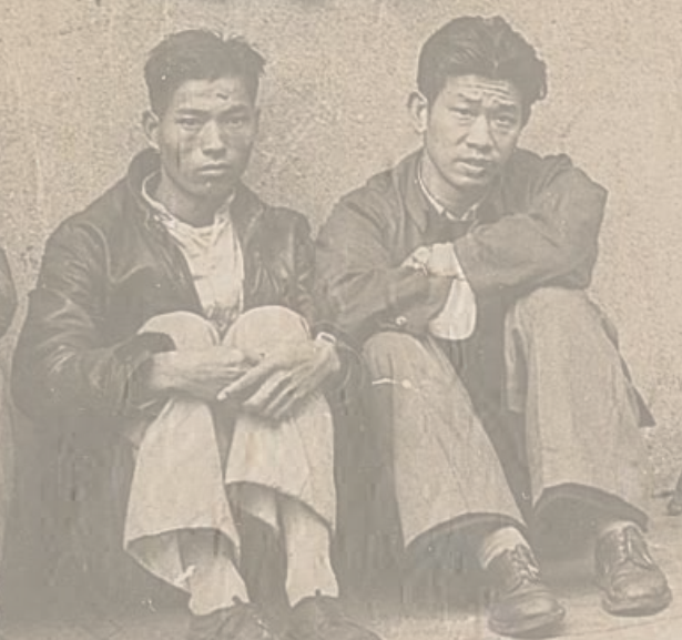
德和輪工潮 工友要求合理遣散