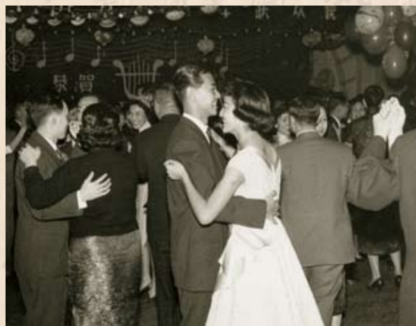
婦女界舉行新春聯歡舞會籌款