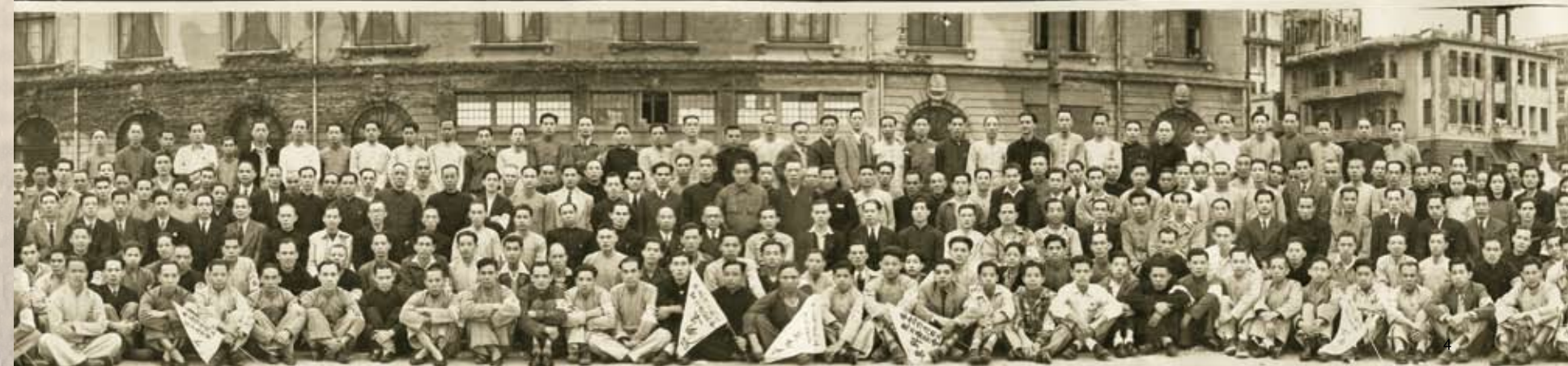
日三廿月三年七卅國民念紀影留五復五職員華全店酒大島半