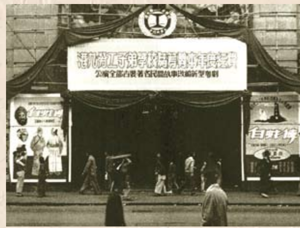
工人粵劇團在高陞戲院演出《白蛇傳》籌款