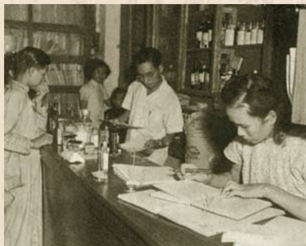
1950年7月3日，工人醫療所借用勞教會半間會所開始為病人診症。