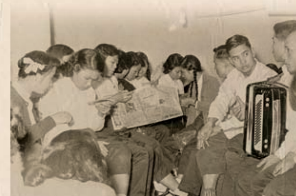
年青工友在看書閱報