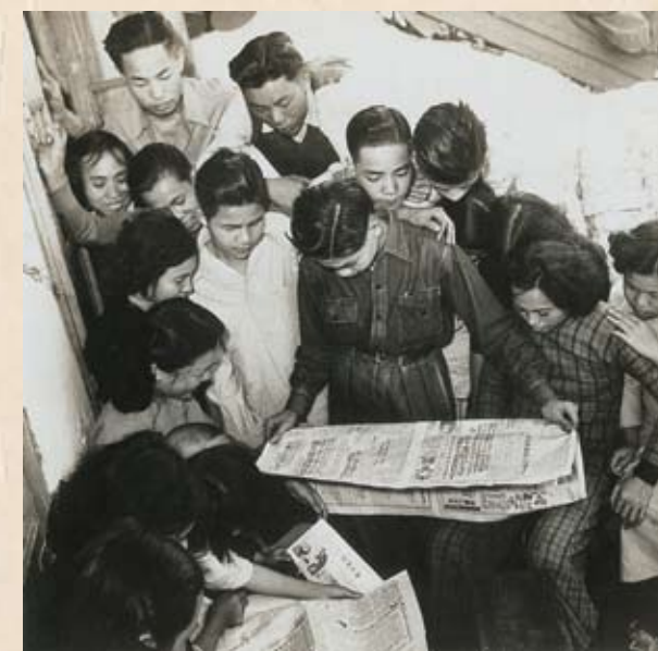
災民爭看一月一日大公報刊載粵穗分會撥款送米賑災的消息