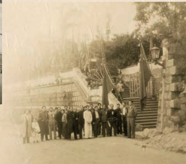
第三屆代表大會會場外