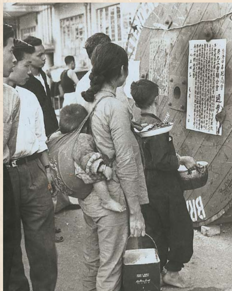
1953年12月25日，六村大火的災民在街頭觀看中華總商會和港九工會聯合會的賑災通告，心頭湧起一股暖流。

六村大火 1953年12月25日，深水涉石硤尾等六村發生空前大火，災民6至7萬。中國人民救濟總會粵穗分會及時匯來人民幣10億元（折合港幣23萬多元），送來大米70萬斤。工聯會和中華總商會接受委托，於1954年1月14日，分別在界限街陸軍球場及楓樹街長沙灣球場進行發放。