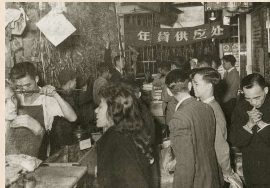
百職工會服務部供應年貨