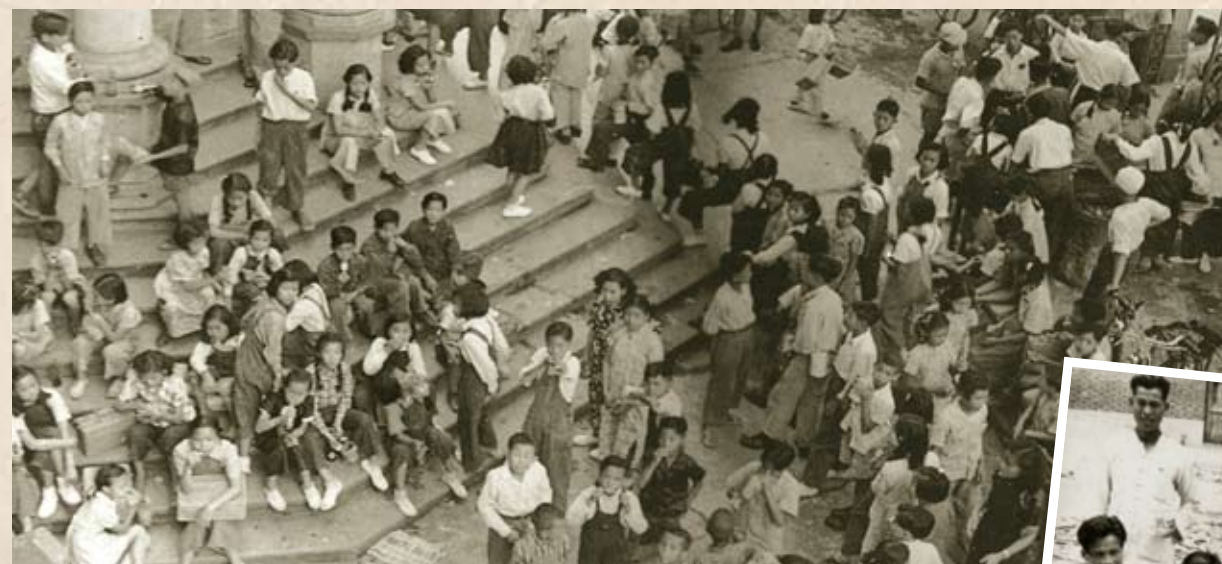
1950年原租用的旺角勞校校舍被業主收回。勞教會於6月3日展開勞校賣花籌款建校運動，售花超過一百萬朵，捐款達28萬3千多元，創下香港賣花籌款紀錄。圖為在當時位於彌敦道的校舍，參加賣花的工人、學生正排隊交錢箱。