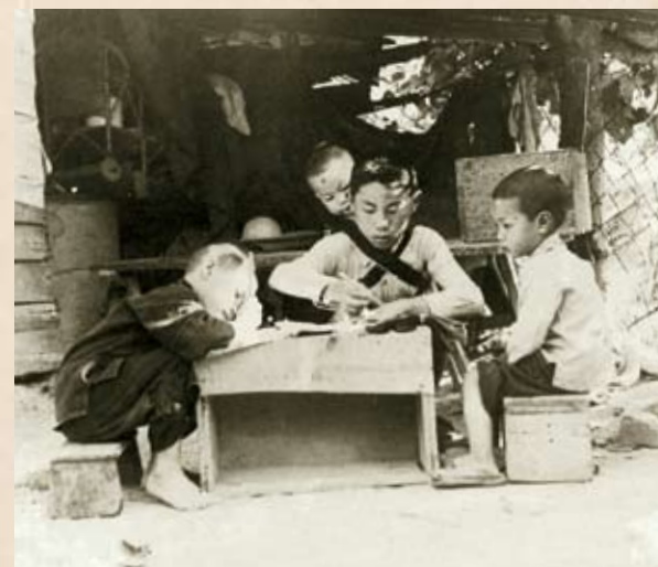
當年工人子弟艱苦讀書的情景

勞校由創辦（1946年）、建校（1951年）到擴建（1957年）和改建（1985年），以及每年辦學經費的籌措，都與各行各業的工人和社會各界的熱情支持分不開。