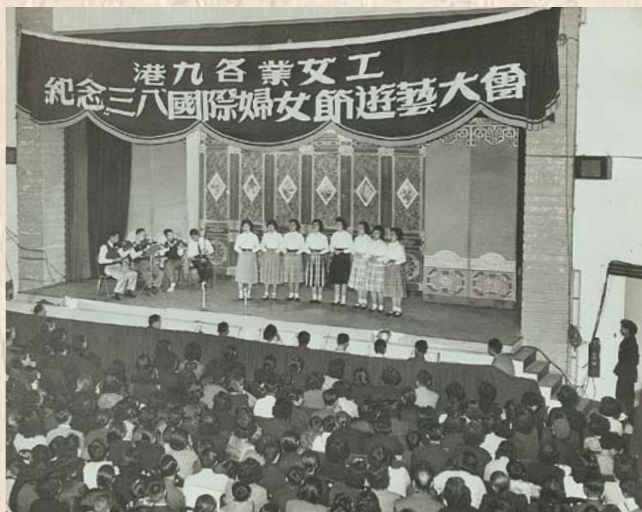
工聯會在1949年成立「女工作委員會」，協助工會建立和健全女工部，指導女工學習及辦理女工福利工作，培養了一大批工會工作人員。圖為1952年港九各業女工紀念「三八」婦女節。