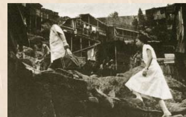
工人醫療所工作人員到山區探訪病人