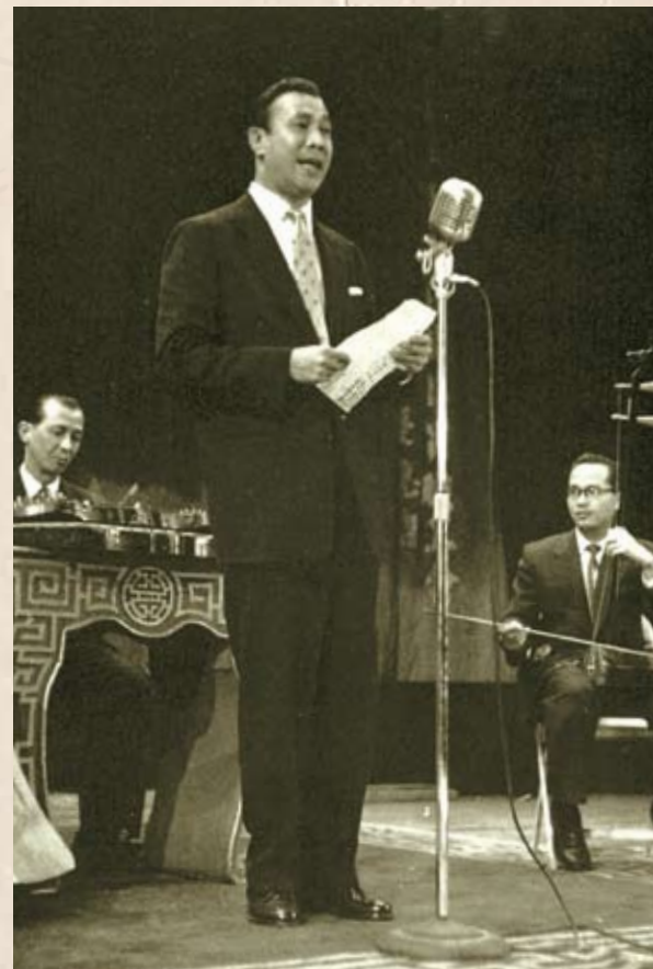
吳楚帆先生演唱他的首本粵曲《不堪重睹舊征袍》（1959年）