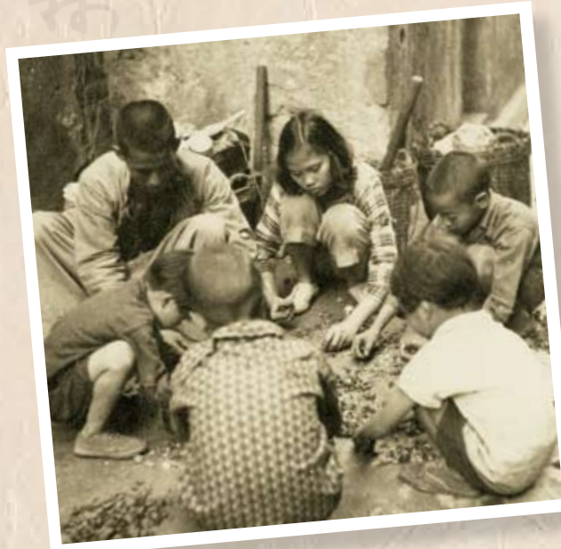
兄弟姐妹一起幫手揀煤渣