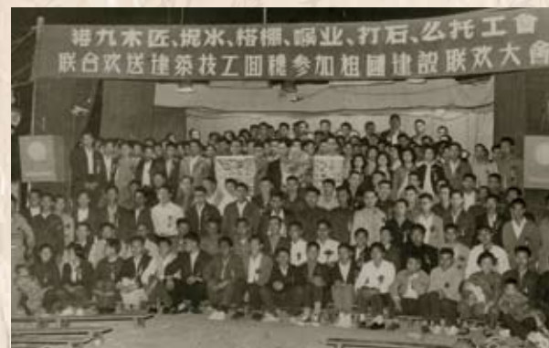
回穗參加祖國建設的香港建築工人在歡送會上合影

技工回國建設 1958年，在祖國社會主義建設高潮鼓舞下，近萬名香港技術工人回內地參加國家建設，把技術獻給祖國。