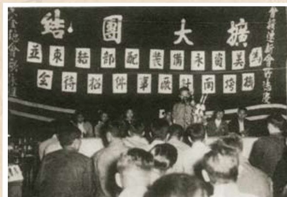
美資永備裝配部爭取生活費 1958年，在美資永備裝配部擠垮南針廠事件中，五金工會為工友爭取到80天生活費。