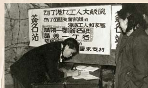
五金工人為支持海塢工友的鬥爭發起簽名行動