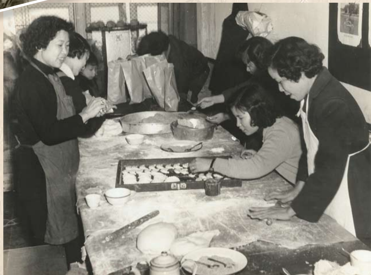
婦女們自己動手做油角，慰問工友。