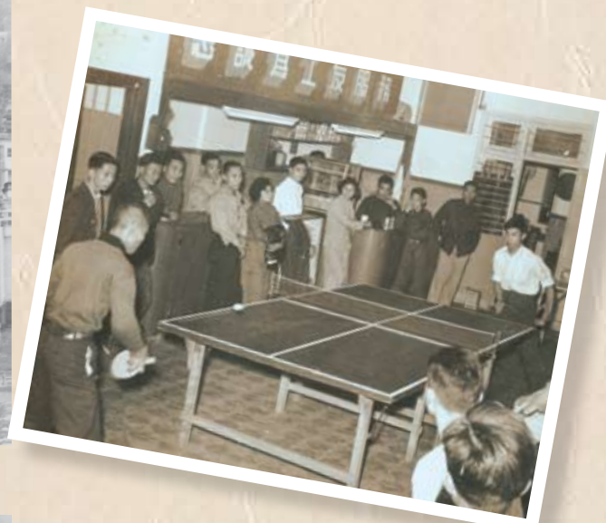
五金工會乒乓隊與友隊在工會福利部進行比賽