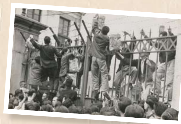
海軍船塢工友和家屬為在廠靜坐抗議的工人送上乾糧

海塢閉廠鬥爭 1957年11月，香港海軍船塢突然宣佈兩年內關閉，解僱全廠4,600名員工，政府宣稱不會負責安置員工職業。工聯會及各工會成立支援委員會，各業工人40多萬人簽名支持。海塢員工堅持了20個月的說理鬥爭，直至1959年6月終於爭取到員工就業和補償。