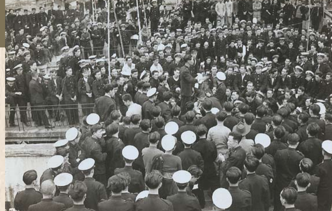
1949年12月28日中午，電車工人在羅素街工會相連的天台舉行大會。

特津鬥爭 1949年12月23日，牛奶工會聯合洋務工會屬下牛奶冰室幹事會，正式向資方提出增加90元特別生活津貼的要求，經多次談判交涉，迫使資方讓步，於1950年3月24日公佈「仲裁」結果，爭取到每人每月30元特津。其後各公用事業爭取改善待遇鬥爭的僵局獲得打破，先後按牛奶仲裁結果解決。