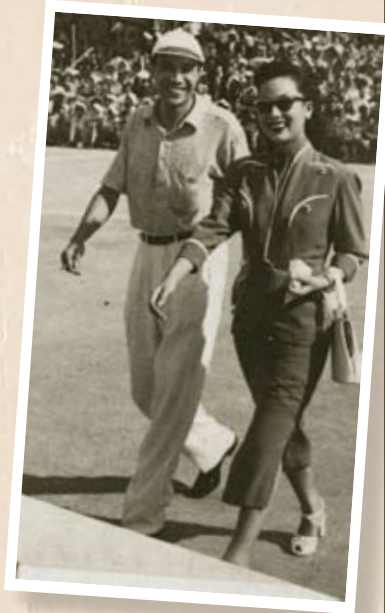
足球界、伶星界舉行足球義賽籌款，吳楚帆先生陪同白燕小姐主持剪綵禮。