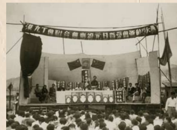
1950年元旦，工聯會在灣仔駱克道142號的天台舉行慶元旦暨愛國運動頒獎大會。