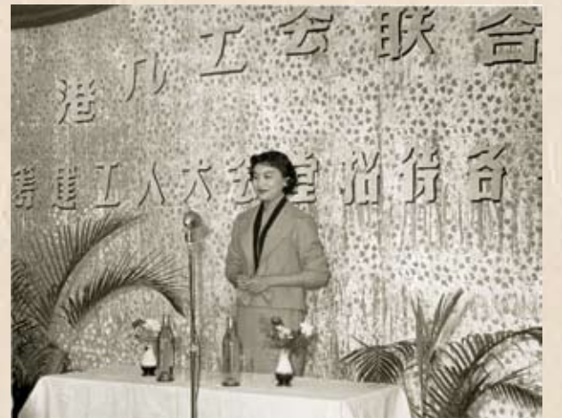
影星夏夢在茶敘會上講話