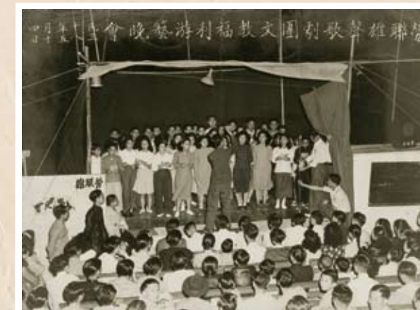
1949年5月14日舉辦的歌劇團文教福利遊藝晚會