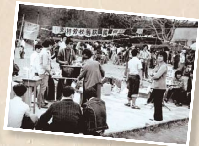
1959年港英教育司無理取消一貫給予勞校的經費津貼，印刷工人大力支持勞校籌款，一定要把勞校辦下去。