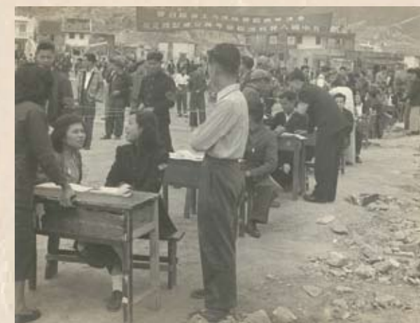
東頭村大火，中國人民救濟總會粵穗分會撥款運米救濟受災同胞。