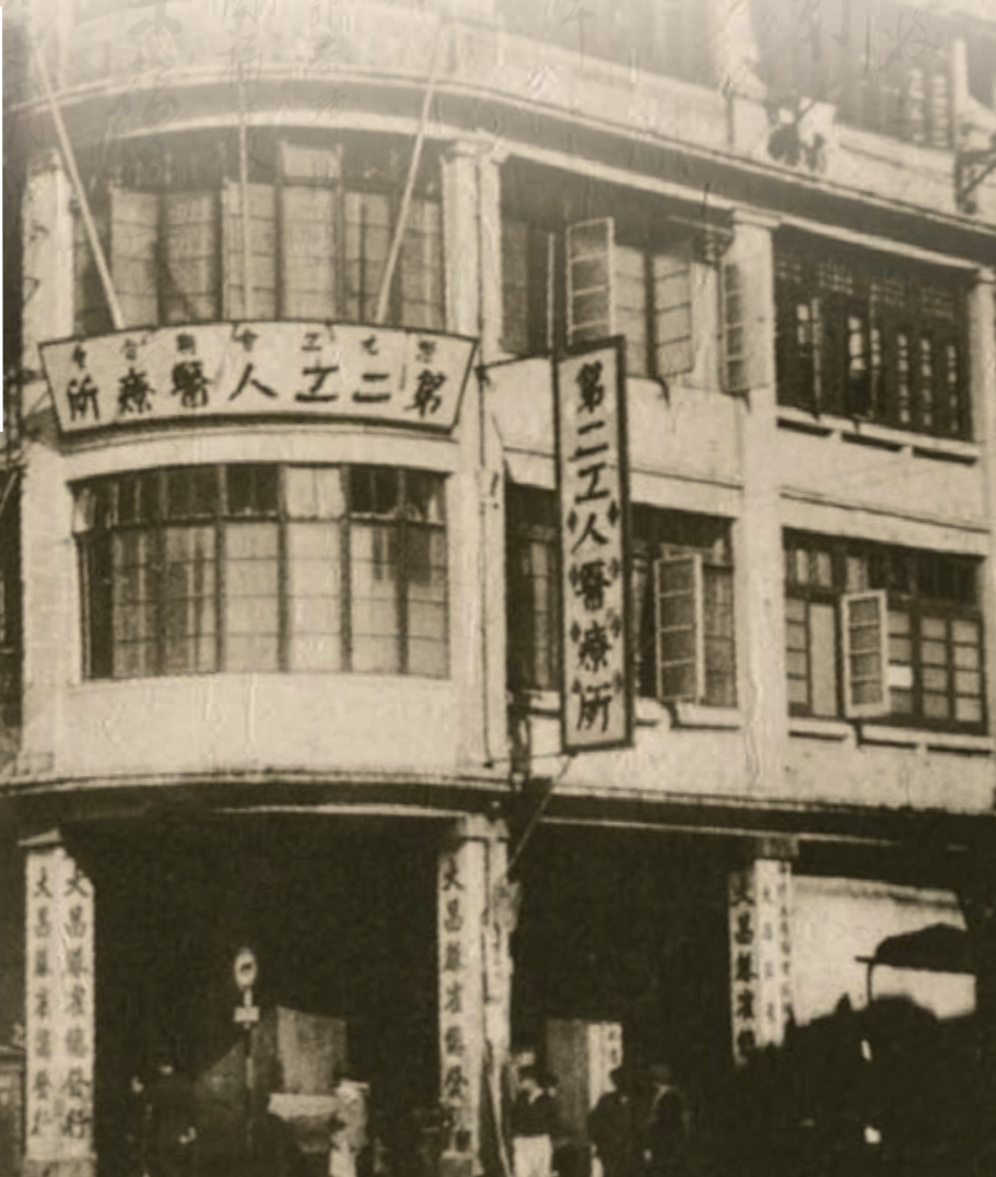
1951年7月15日成立第二工人醫療所