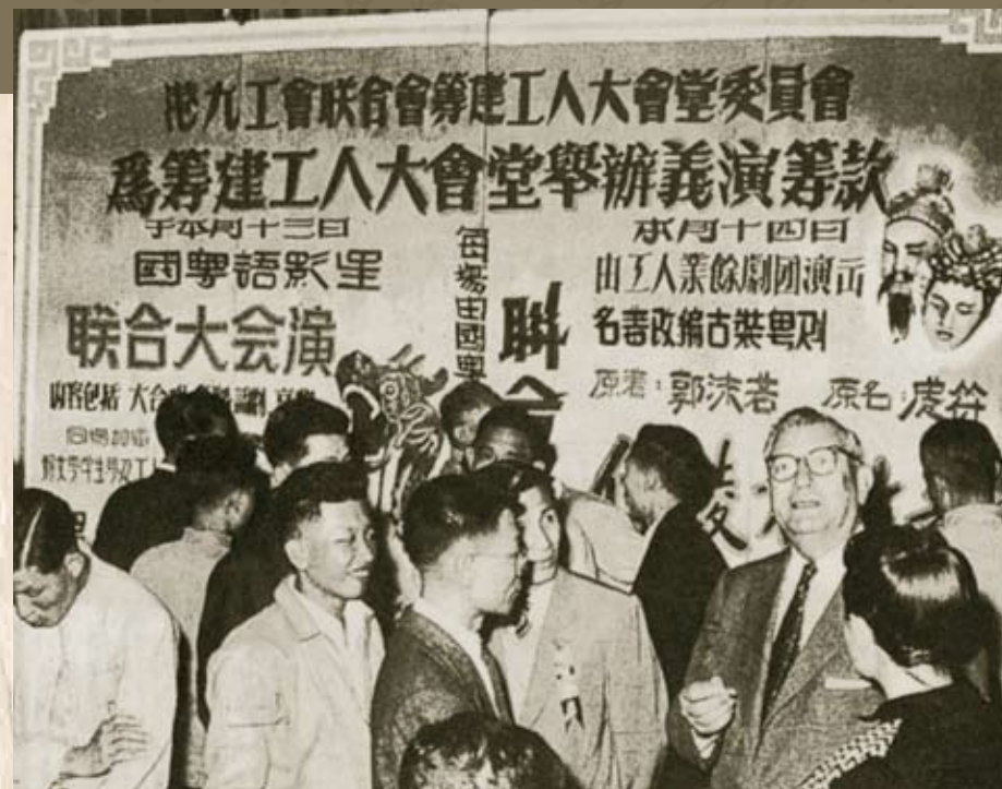
圖右的外籍人士為參加義演的鋼琴演奏家夏理柯教授