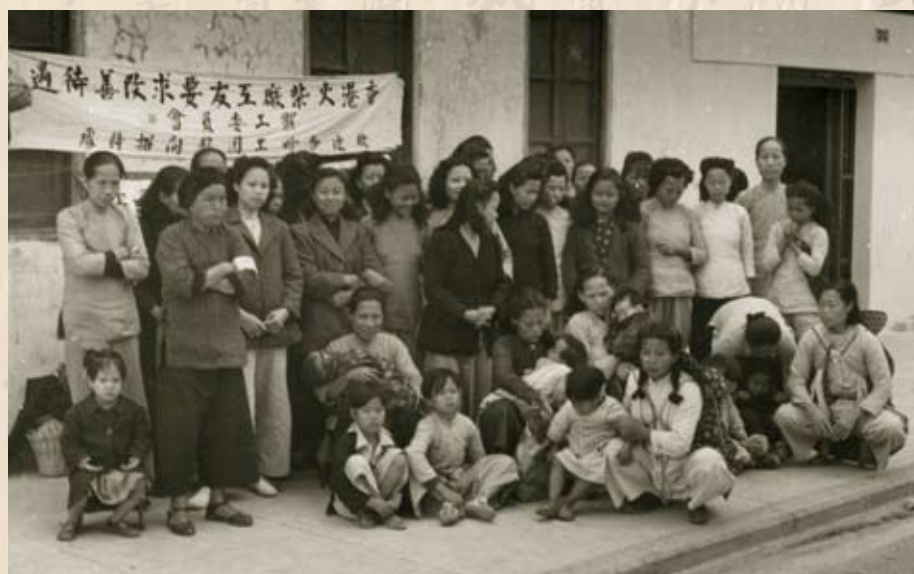
火柴工人罷工 1949年，香港火柴廠工友要求改善待遇。