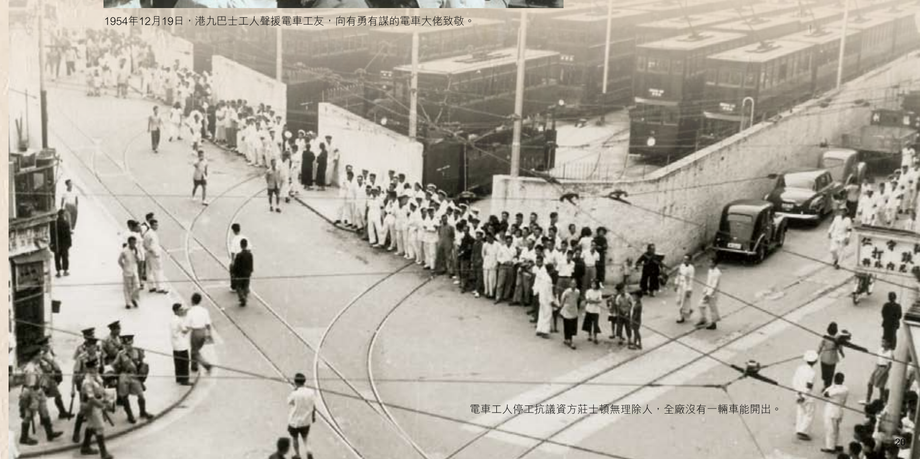
電車工人停工抗議資方莊士頓無理除人，全廠沒有一輛車能開出。