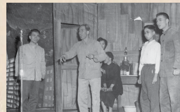
1958年在電車、電燈、電話工友接待海塢工友晚會上，工友自編自演話劇《血淚圖》。