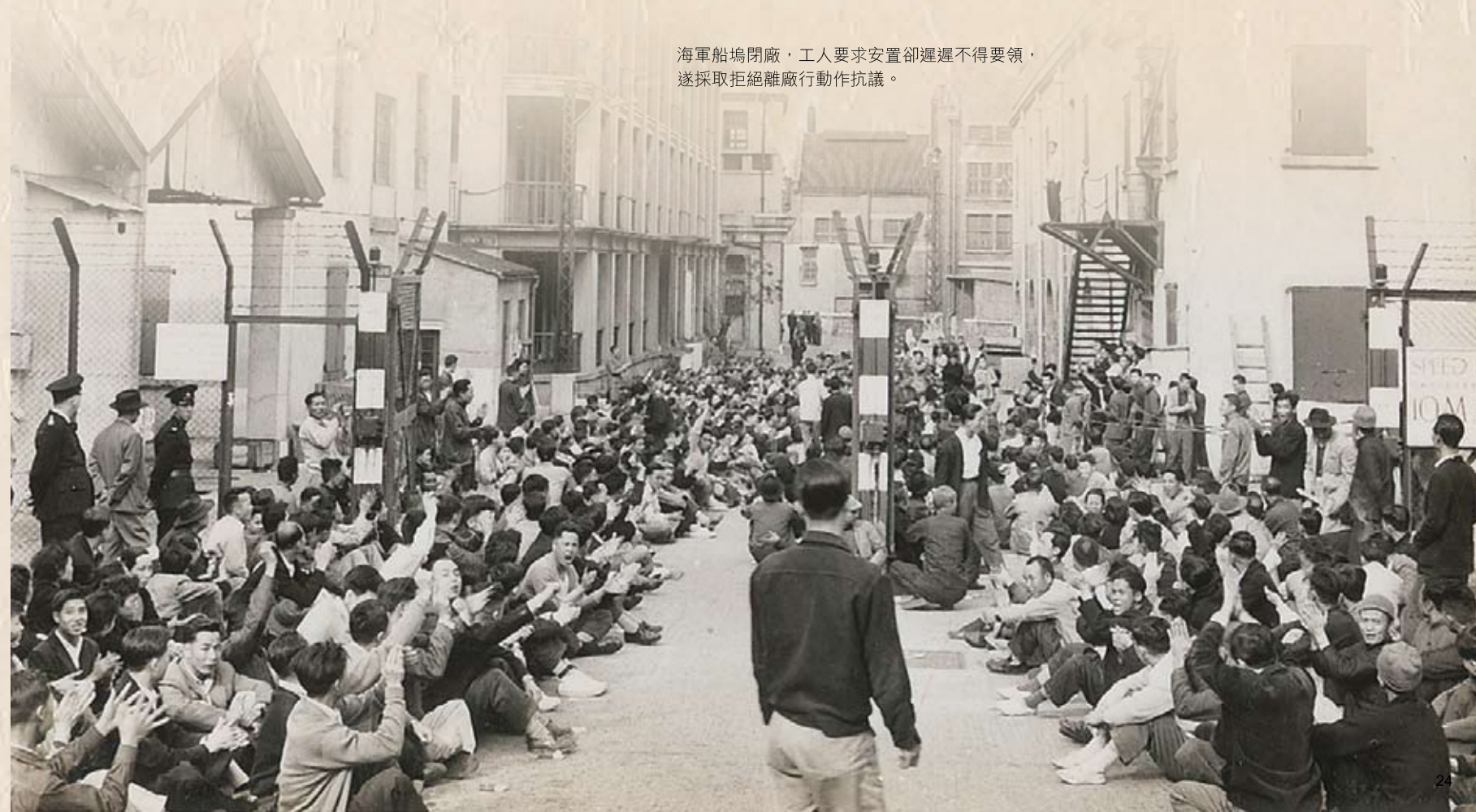
海軍船塢閉廠，工人要求安置卻遲遲不得要領，遂採取拒絕離廠行動作抗議。