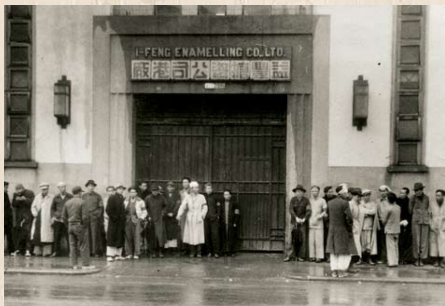
益豐搪瓷廠工友要求改善生活 益豐搪瓷廠工人提出四項改善生活的要求，資方拒絕談判，開除8名工人代表，並於1952年2月16日宣佈關廠停工。搪金工會支持工友，堅持鬥爭了一個月。復工後，工人獲得加薪及年終獎金。