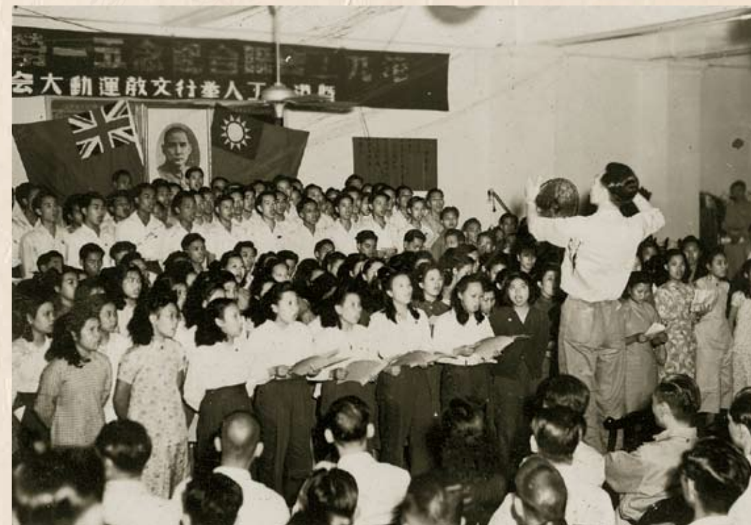
1949年5月，工聯會舉行紀念「五·一」勞動節暨港九工人文教運動大會。