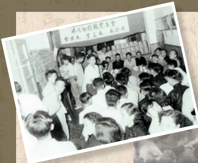
印務工會辦好廉價飯堂並進行失業慰問