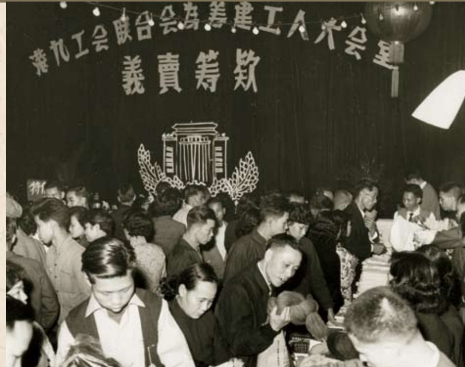
工聯會進行義賣籌款