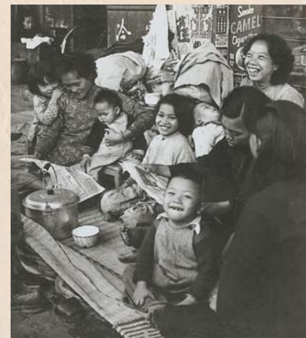
露宿街頭的災民，看到發放救濟糧、款的新聞後笑逐顏開。