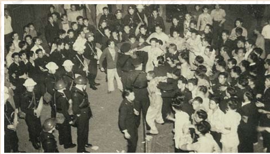
警察嚴陣以待，阻止群眾前往慰問。

血濺羅素街事件 1950年1月30日晚，38個青年團體近千人，事先獲警方答允，前往設在羅素街的電車工會慰問，不料遭到警方開槍鎮壓，發生了嚴重的流血事件，引起社會震動。