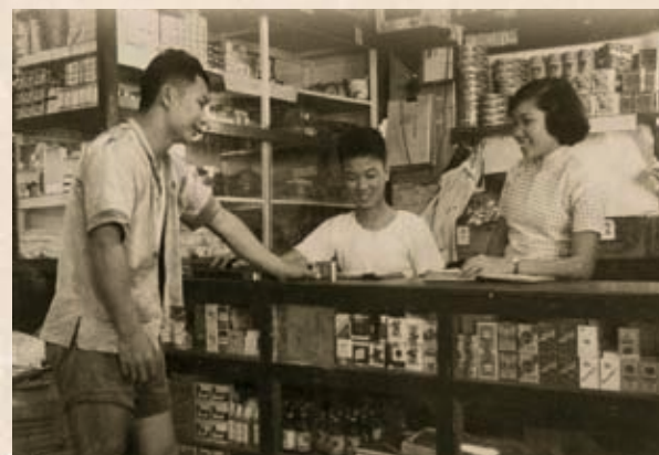
早期的牛奶工友服務部