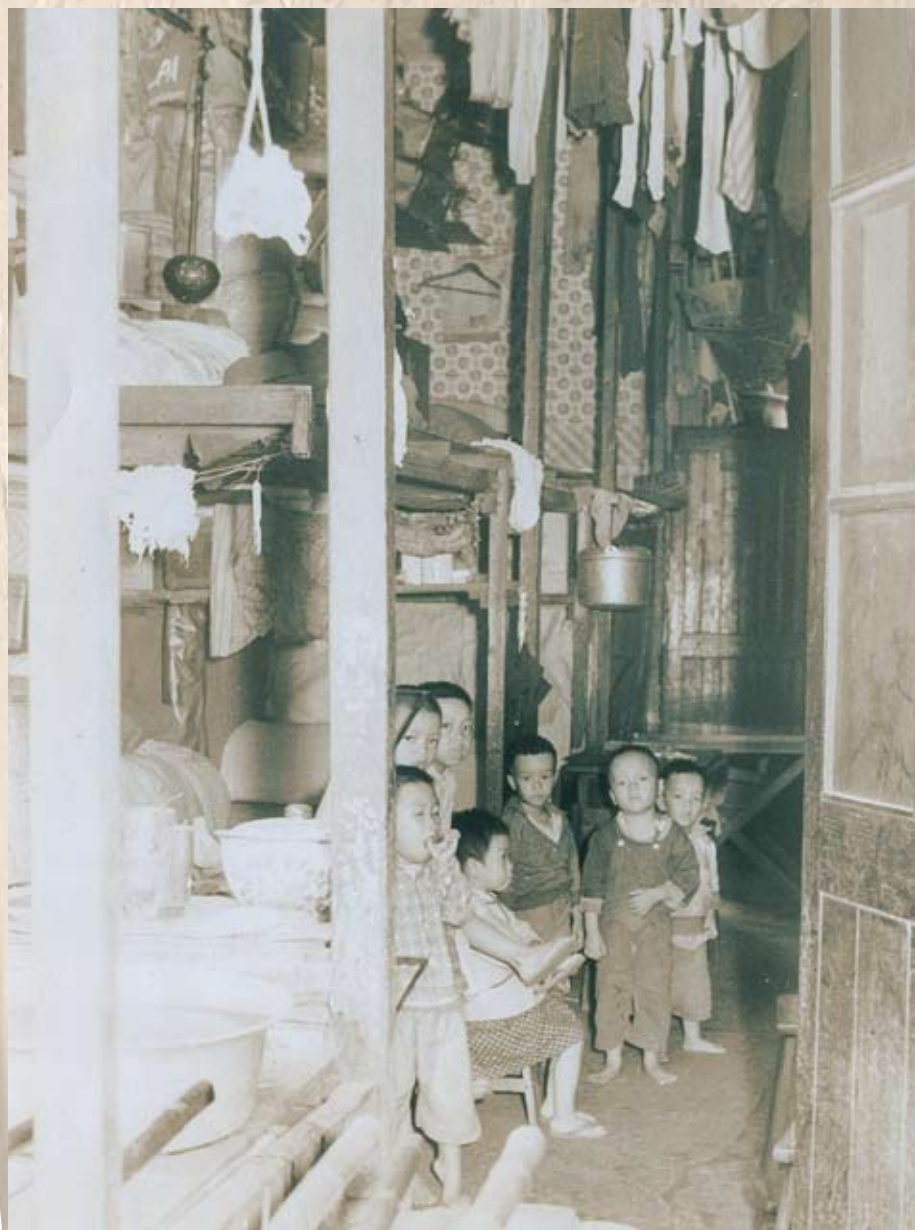
勞苦大眾的居住環境極為惡劣