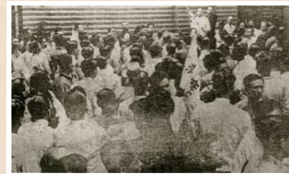
四大酒店護約鬥爭 1948年2月，四大酒店（香港、半島、淺水灣、麗都）資方毀約，工會為維護工友權益，進行護約鬥爭，1,200多名酒店工人於3月19日開始罷工，至3月23日取得勝利，全體復工。

三大船塢（海軍、太古、九龍）工人於1946年爭取到香港百年來前所未有的八小時工作制；印刷工人亦取得全行業八小時工作制的成果；港燈於1946年7月5日成功簽訂了第一個勞資協議；1947年四電一煤（電燈、電話、電車、中電和煤氣）、港九兩巴等各業工人分別取得改善待遇的勝利，推動了香港工人運動的發展。