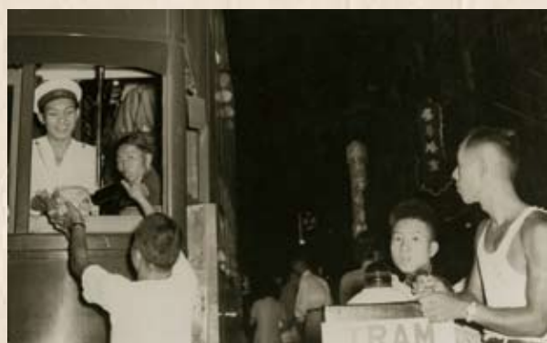
當年的電車工人沒有膳食時間，電車服務部工友在站頭為開工工友送上熱飯熱茶（1954年）。