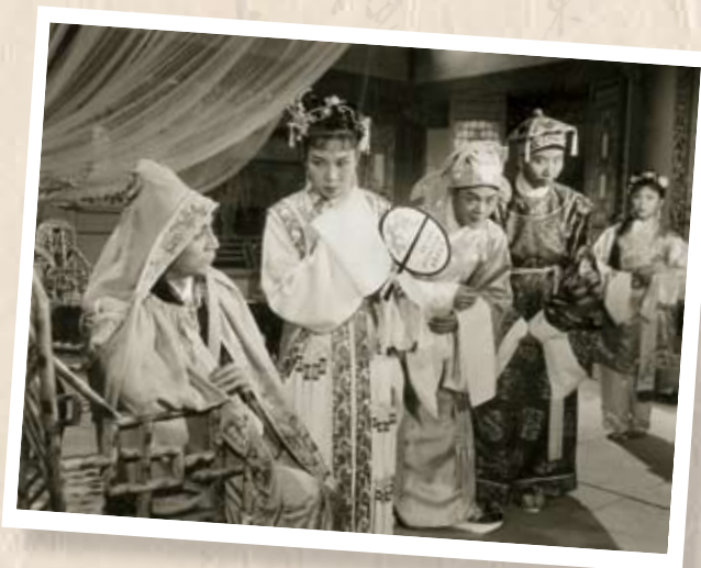
工人業餘粵劇團參與開拍電影《喬老爺上花轎》，新聯公司在五間戲院義映一天，為籌建工人俱樂部出力。