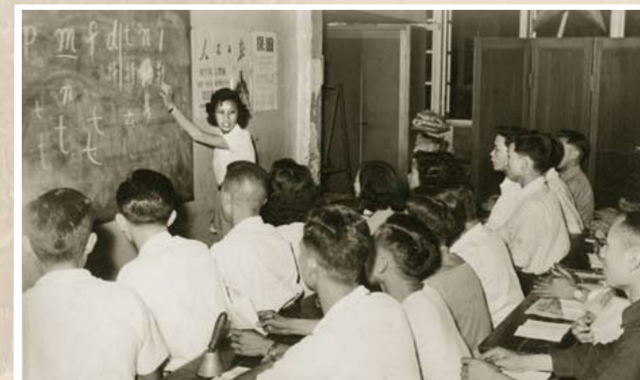
油漆業工會文化班