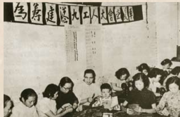
南洋煙草公司女工義車籌款