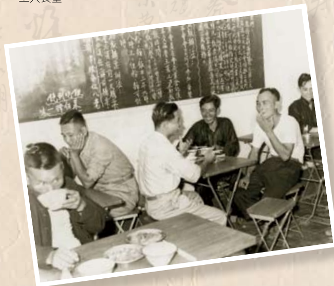
海員工會工人食堂