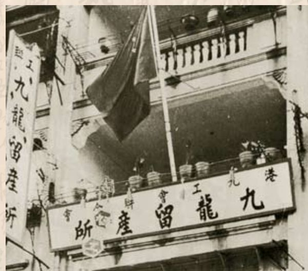
1952年4月6日，九龍留產所開幕。