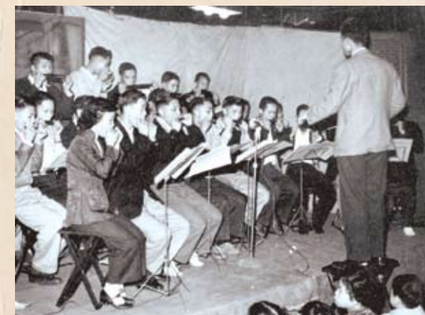
石印工會口琴組在演出

工聯會於1949年成立「歌劇輔導委員會」，協助工會普遍成立歌劇組、文娛班組，創作適合工友口味而有教育意義的歌劇及文藝節目；又於1954年設立工人康樂館，推動屬會開展各類體育活動，有小型足球賽、乒乓球賽、籃球賽，象棋賽以及陸運會、水運會等，吸引了大量年青人參與，鍛煉和培養了大批工作人員，促進了工會的發展和壯大。