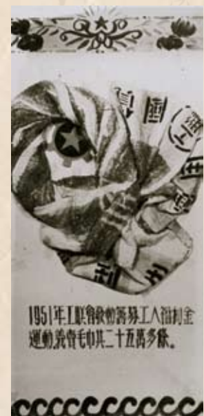
1951年工聯會發動籌募工人福利金運動，我賣毛巾二十五萬多條。