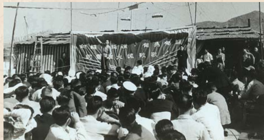
1954年12月19日，港九巴士工人聲援電車工友，向有勇有謀的電車大佬致敬。

電車反「莊式除人」鬥爭 1954年7月，電車公司資方有計劃地開除電車工會工作人員和工會負責人，以達清除工會力量之目的，電車工人稱之為「莊式除人」。電車工人在忍無可忍的情況下採取了兩次停工抗議行動。工聯會於10月成立「促進談判解決電車糾紛委員會」，經過近8個月的鬥爭，至1955年2月阻遏了「莊式除人」的狂勢。